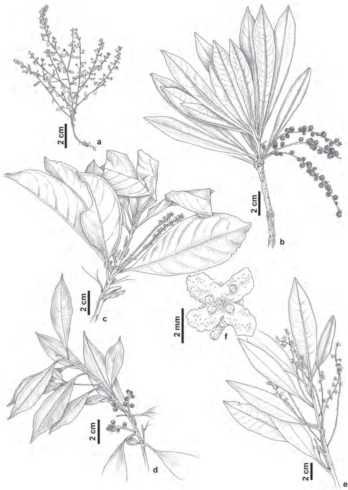
Fig. 1. A. Anagallis pumila : hábito. B. Cybianthus alpestris : ramo com frutos. C. Cybianthus detergens : ramo com flores. D. Cybianthus brasiliensis : ramo com frutos. E-F. Cybianthus coriaceus : E. ramo com flores. F. flor estaminada. (A. Cordeiro CFSC 8164; B. Pirani 5075; C. Menezes CFSC 4889; D. Pirani 12849; E-F. Henrique CFSC 5781).