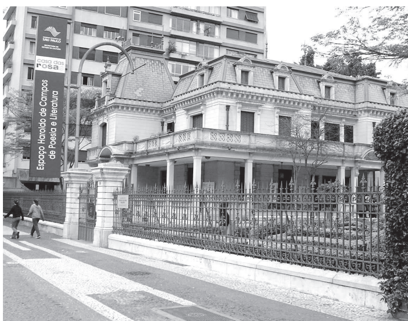
Casa das Rosas: um marco na avenida Paulista.

Depois de cerca de dois anos fechada, a Casa das Rosas foi reaberta ao público em 9 de dezembro de 2004 pelo governador de São Paulo, Geraldo Alckmin, com o intuito ímpar de se transformar em pólo irradiador de poesia e literatura. Às novas funções, acrescentou-se também uma nova designação: Espaço Haroldo de Campos de Poesia e Literatura, em homenagem ao grande poeta falecido em 2003, cuja biblioteca, com cerca de 35.000 volumes, a Casa passou a abrigar.