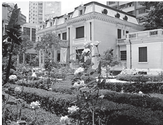
A mansão Casa das Rosas, construída em estilo clássico francês.