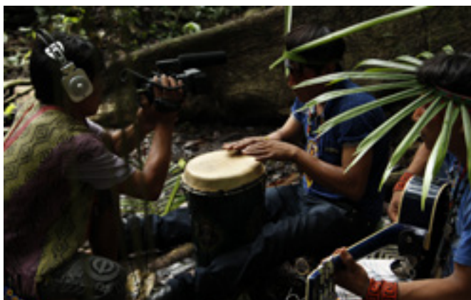
figura 2 Gravação de música

Com as vivências e oficinas em equipe, reuniu-se um volume considerável de material etnográfico, tanto em termos de áudio (cantos “tradicionais” e também aqueles com novos arranjos e instrumentos, assim como efeitos sonoros), como de imagens, tais como fotografias, vídeos e os desenhos, os quais se tornaram referência para a criação de objetos e animações do jogo.