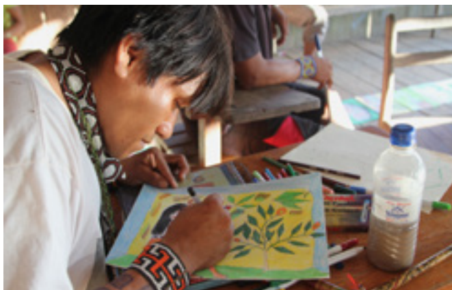
figura 1 Oficina de desenhos das histórias

Os desenhos foram feitos por todos os participantes das oficinas, sem distinção sobre o nível de aptidão na execução da atividade. Os desenhos também sofreram significativa seleção da equipe, já que praticamente todos foram incluídos no jogo (na forma de cutsscenes ), conforme a sequência das cenas a que correspondem nas narrativas. Com isso, formou-se um mosaico de desenhos de autores e qualidades diferentes, mas que mantém um estilo comum, huni kuĩ .