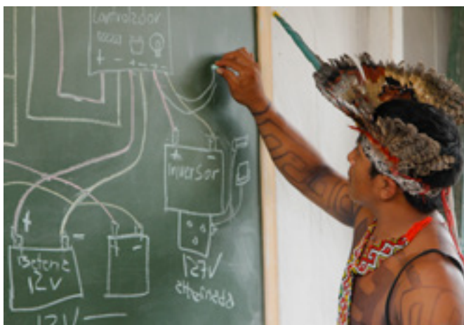
figura 6 Oficina de manutenção de sistemas de energia solar

Por iniciativa própria, os moradores prontamente nomeavam o ponto de cultura recém-criado. Estima-se que este projeto colaborou com a iluminação de 100 casas em oito aldeias, nas quais vivem entre 500 e 1.000 pessoas, como coloca Tadeu Kaxinawá: