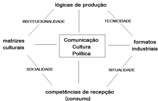
FIGURA 2 – Mapa das mediações comunicacionais da cultura

Hjarvard (2012, 2015), a seu modo, parece reconhecer a mesma institucionalização das novas formações midiáticas como um fator fundamental para análise do mundo contemporâneo: “Ao aplicar uma perspectiva institucional, é