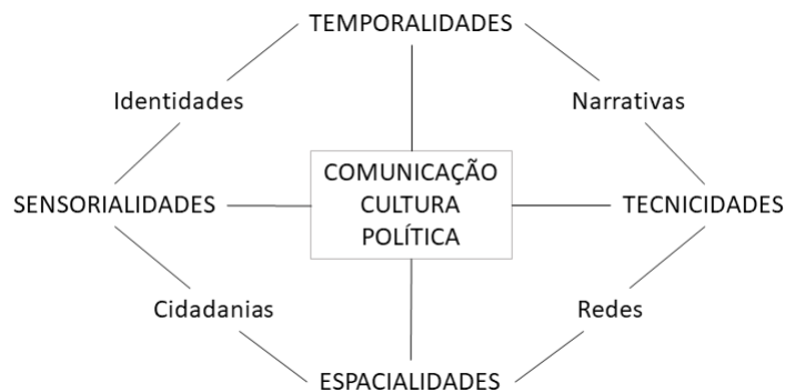
FIGURA 5 – Quarto Mapa Metodológico das Mediações – 2017 Mutações Culturais e Comunicativas Contemporâneas - 2