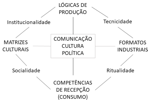
FIGURA 3 – Segundo Mapa Metodológico das Mediações – 1998 Mediações Comunicativas da Cultura

Fontes: Convenio Andrés Bello, Bogotá, 1998; Ed. UFRJ,