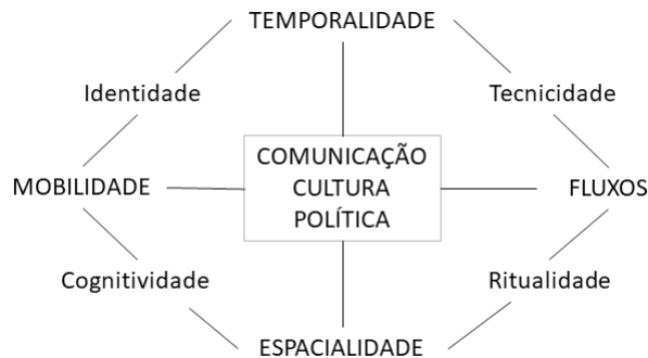
FIGURA 4 – Terceiro Mapa Metodológico das Mediações – 2010

Mutações Comunicativas e Culturais Contemporâneas