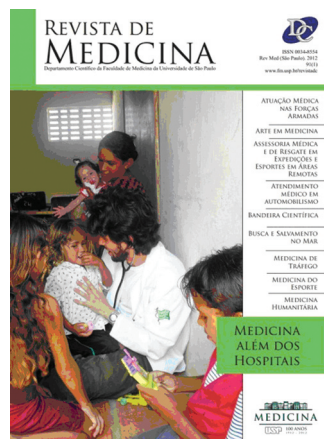
Figura 1. Capa da edição 91(1) da Revista de Medicina

central a “Medicina Além dos Hospitais” (Figura 1). A primeira parte do evento foi reservada para o filme “(Un)Limited”, que conta a história dos 40 anos de existência da organização Médicos Sem Fronteiras, e que foi seguida de debate com integrantes da organização. A seguir, pensando no intercâmbio de experiências entre profissionais e alunos, foram apresentados projetos desenvolvidos na FMUSP (Bandeira Científica e a Jornada Universitária da Saúde), prosseguindo com uma mesa redonda sobre experiências médicas além dos hospitais.