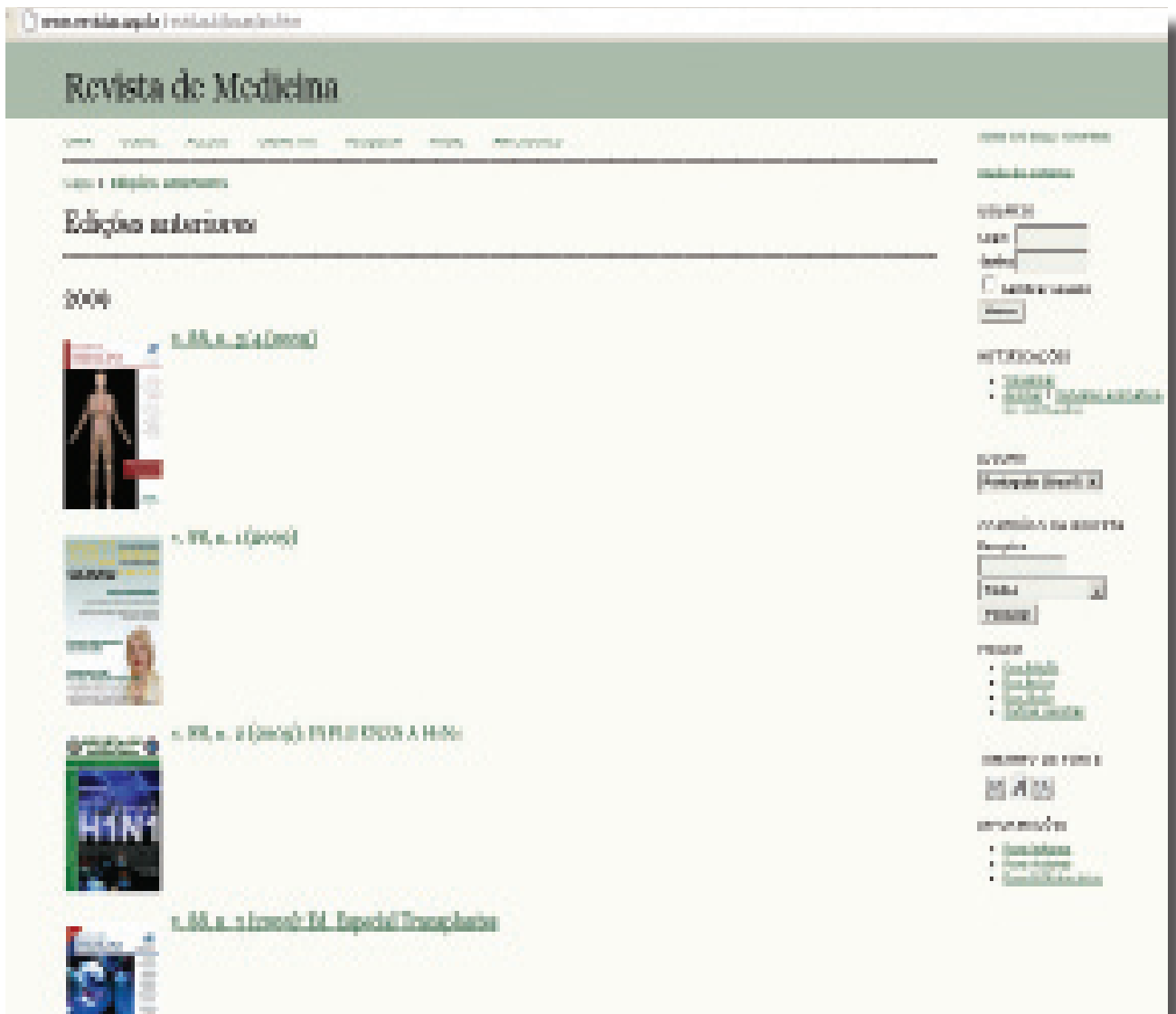
Figura 2. Portal de Revistas da USP ( http://www.revistas.usp.br/revistadc )