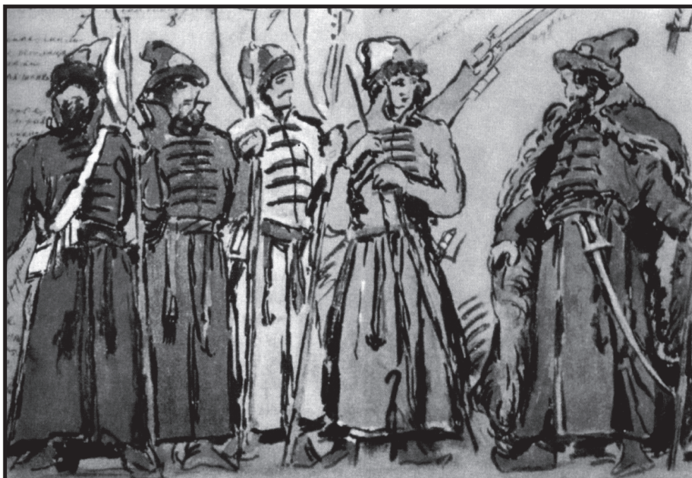
Nesta página e na anterior, dois desenhos de Konstantín Korovín para uma montagem da Khovânshtchina em 1911

A ópera russa, propriamente dita, data de 1836, com o lançamento de A Vida pelo Tsar , de Mikhaíl Glinka. Embora houvesse forte censura desencorajando temas políticos cantados em russo, Nicolau I gostou muito da música e se sentiu lisonjeado pelo título. Logo seguiram-se outras, como, por exemplo, Ruslân i Liudmíla (1842), do mesmo compositor. Os procedimentos de Glinka vão influir nas obras de Mússorgski, Rímski-Kórsakov e até em algumas de Tchaikóvski e, mesmo, no Demônio , de