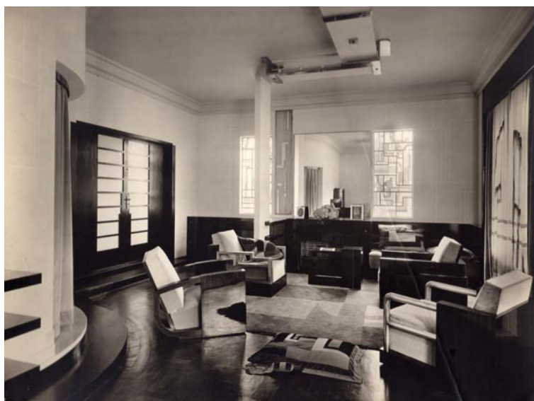
Figura 1: Residência de Mário da Cunha Bueno. Sala.