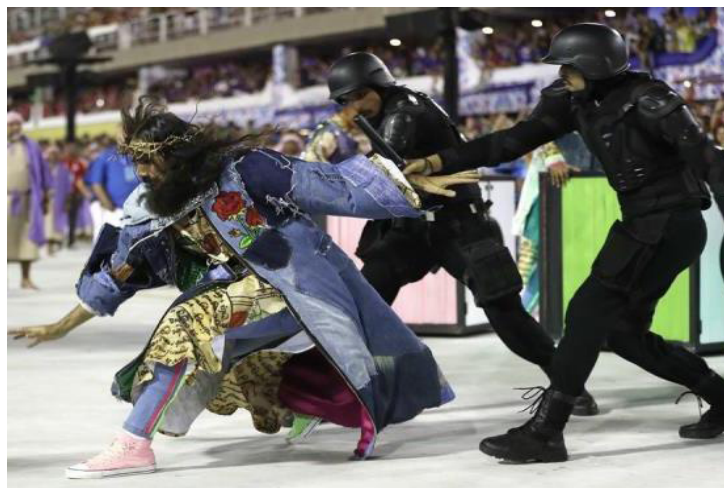
Figura 1: Jesus agredido por policiais na representação da comissão de frente

Terceira escola a desfilir no domingo de Carnaval em 2020, a Mangueira se apresentou com 4 mil componentes distribuídos entre 19 alas, cinco alegorias e três tripés. Intitulada Seu nome é Jesus da gente , a comissão de frente (Figura 1) apresentou um Jesus branco, com cabelos longos, barba e uma coroa de espinhos sobre a cabeça. Embora a fisionomia fosse semelhante à imagem clássica do personagem, seu figurino, assim como a roupa dos apóstolos que o acompanham, era moderno e remetia ao modo de vestir dos jovens das periferias urbanas, com roupas jeans repletas de retalhos, tênis, bandanas e bonés. Os integrantes executam passos de street dance , tiram selfies , são revistados e agredidos pela polícia. Como elemento cenográfico, utilizam 14 cubos, que se transformam em cruz, caixas de som de um baile funk, na mesa da Santa Ceia e no Morro da Mangueira, junto à quadra da agremiação.