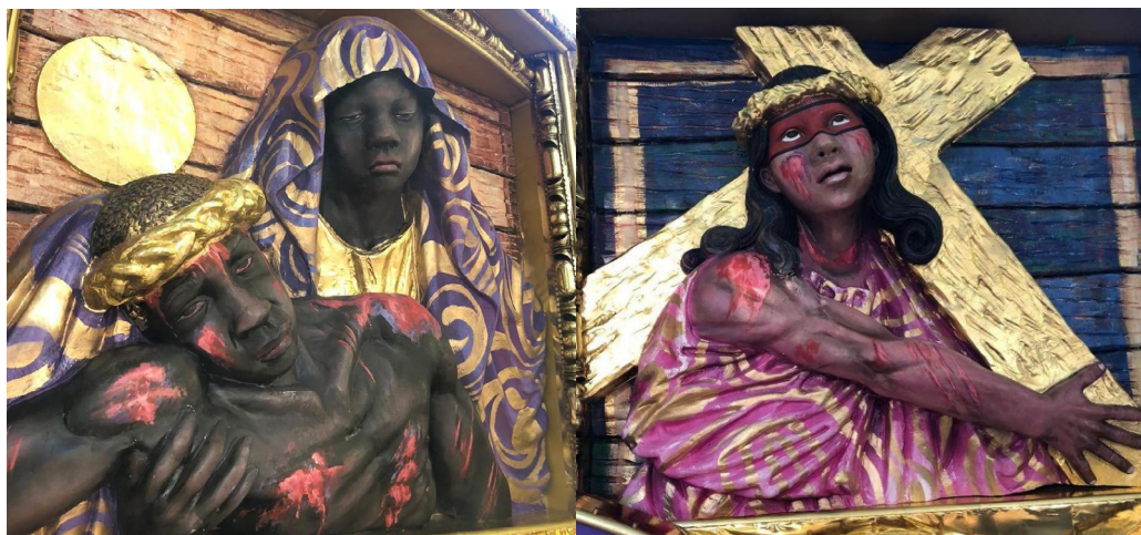
Figuras 3 e 4: Detalhes da lateral do carro As faces dolorosas da paixão

Finalizando o setor, a alegoria As faces dolorosas da paixão (Figuras 3 e 4) mostra um coração cravejado de espadas e diversas esculturas – brancas, indígenas e negras – de Jesus e Maria com semblantes de sofrimento devido ao ritual de tortura e crucificação pelo qual o personagem passou. Cores escuras e decoração barroca completam o cenário.