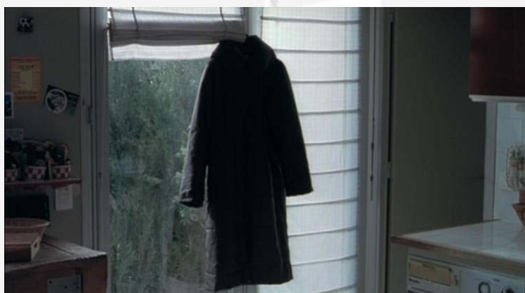
Fig.5: a jaqueta da esposa pendurada revela o poder de lembrar-se dos sujeitos a partir de seus objetos.