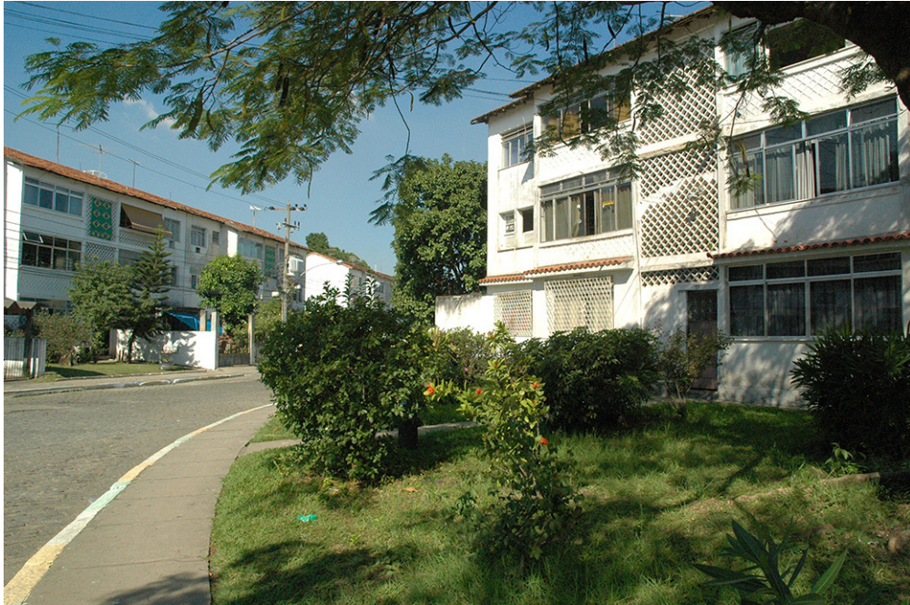
Figura 5 – Conjunto Residencial Moça Bonita, Rio de Janeiro. Esse empreendimento é conformado apenas por esse tipo de bloco de habitação coletiva. As paredes da circulação vertical, vedadas com elementos cerâmicos vazados (os cobogós), e os telhados em duas águas aproximam a solução formal do edifício das imagens que foram usualmente atribuídas à arquitetura moderna carioca, desenvolvida nas décadas de quarenta e cinquenta.