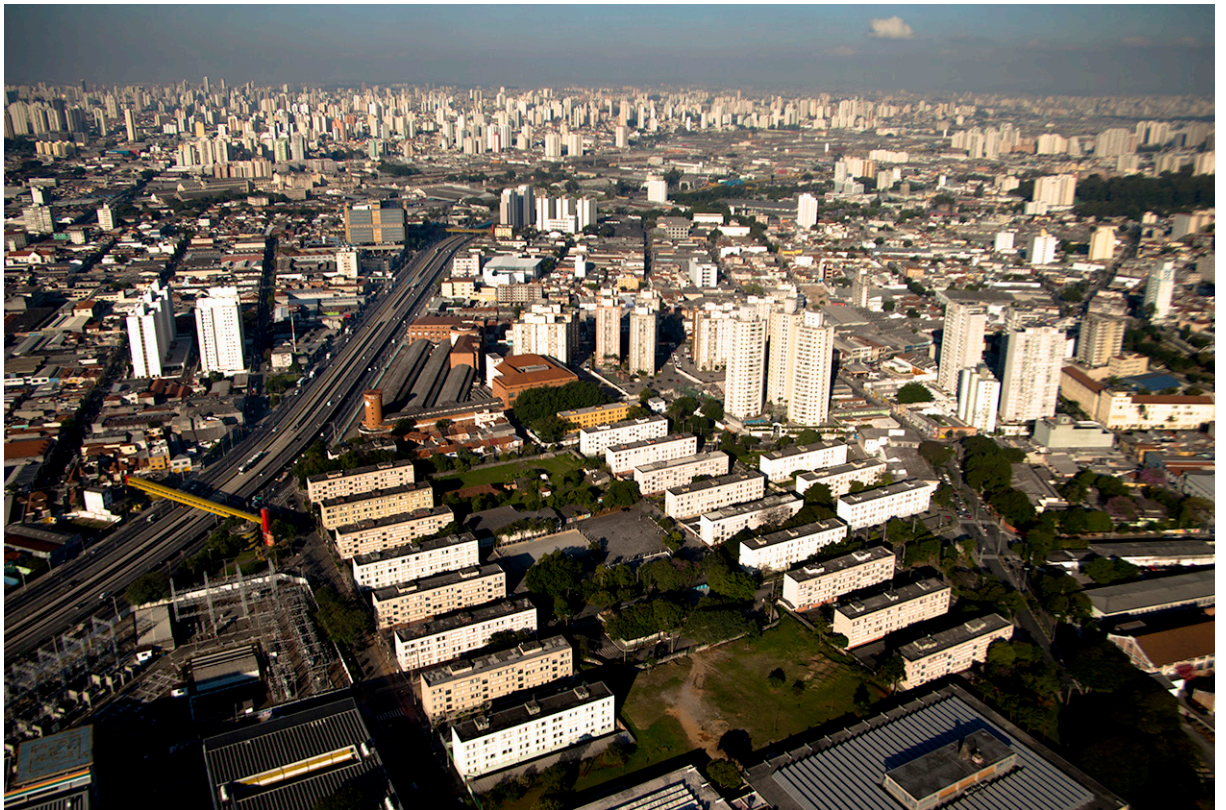
Figura 8 – Conjunto Residencial da Várzea do Carmo. Projeto de Afílio Correia Lima, incrustado na primeira área industrial da cidade, entre o Centro e a Zona Leste.