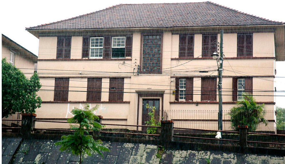
Figura 3 – Conjunto Residencial Passo d’Areia, Porto Alegre. Exemplo de um dos tipos de bloco de habitação coletiva, entre vários outros existentes no conjunto. Destacam-se uma contida ornamentação com os frisos acompanhando as janelas de madeira, a marcação de um pântico na entrada com o elemento vazado envidraçado na abertura que ilumina a circulação vertical e o telhado em quatro águas, que, compondo com o traçado sinuoso das ruas do conjunto, lhe confere a paisagem pitoresca.