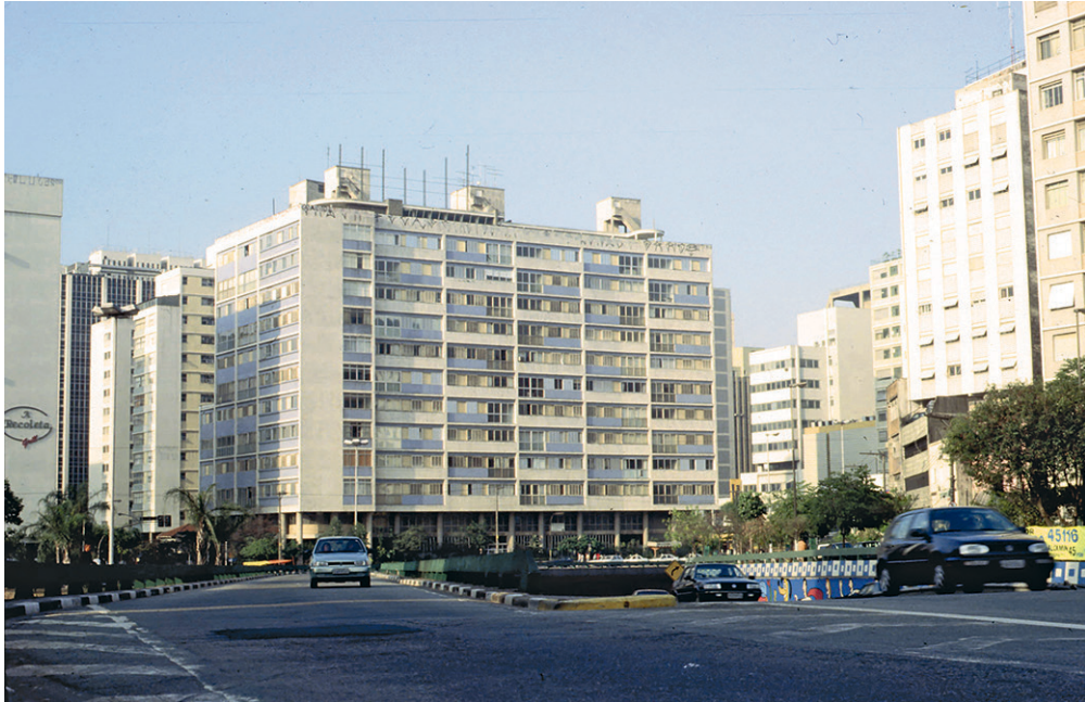
Figura 7 – Edifício Anchieta, São Paulo. Projeto dos Irmãos Roberto, representando a atuação do lapi na dinâmica imobiliária da metrópole paulistana. O edifício está localizado no cruzamento da Avenida Paulista com a Rua da Consolação.