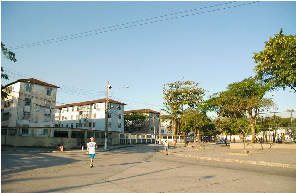
Figura 6 – Conjunto Residencial da Penha, Rio de Janeiro. Esse empreendimento teve um primeiro projeto em 1940 de autoria dos Irmãos Roberto, o que não foi levado a termo. Ao final da década de quarenta, o conjunto foi construído seguindo projeto elaborado pela equipe da Divisão de Engenharia do Iapi. Os edifícios representam, em certa medida, o que foi a solução mais pragmática adotada pelos engenheiros do Instituto, com vedação em alvenaria convencional e fechamento em telhado de quatro águas.