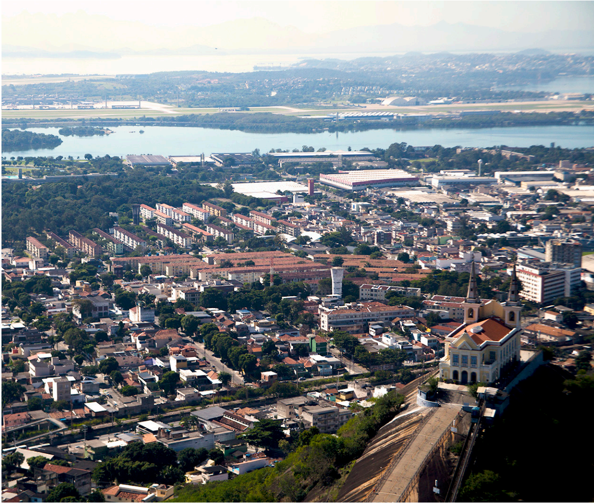
Figura 13 – Conjunto Residencial da Penha, Rio de Janeiro