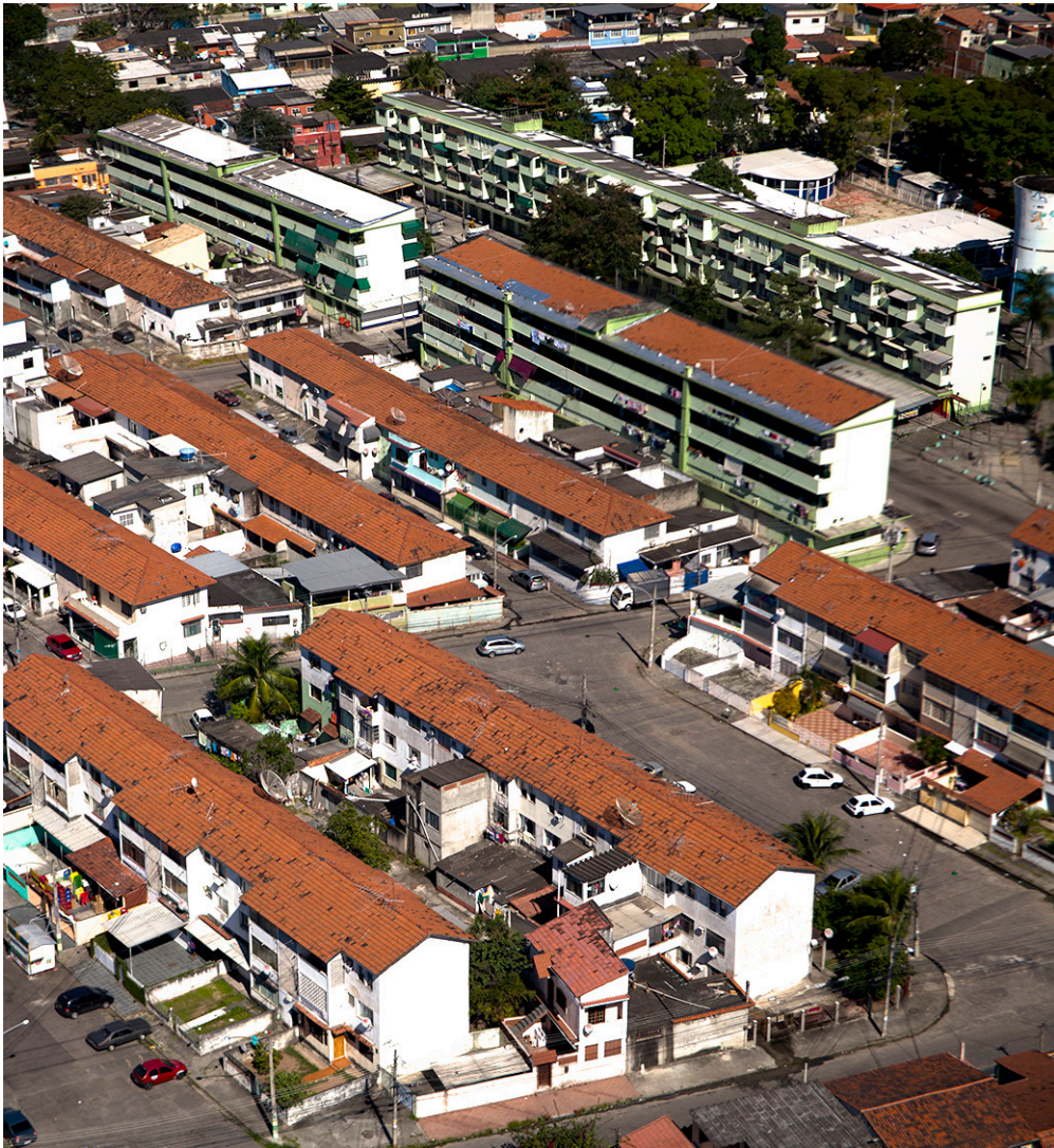
Figura 11 – Conjunto Residencial Operário em Realengo, Rio de Janeiro. O conjunto, projetado pelo arquiteto Carlos Frederico Ferreira, foi o primeiro de grande porte realizado pelo setor público no Brasil. É conformado por diversos tipos habitacionais, desde casas isoladas no lote até esses blocos de habitação coletiva, em destaque na imagem aérea.