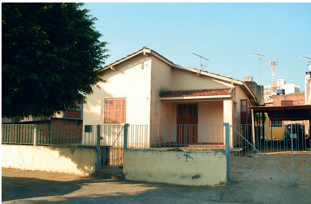
Figura 4 – Conjunto Residencial Piratininga, Osasco (SP). Nas casas isoladas a volumetria simplificada, encerrada por duas águas, é quebrada apenas pelo telhado inclinado da varanda. A solução concilia as formas mais abstratas de quebras geométricas, com o telhado tradicional em cumeeira, típica experimentação da Divisão de Engenharia do Iapi, sob a chefia do arquiteto Carlos Frederico Ferreira.