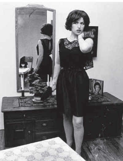
FIGURA 4: Cindy Sherman Untitled Film Still #14 , 1978. fotografia