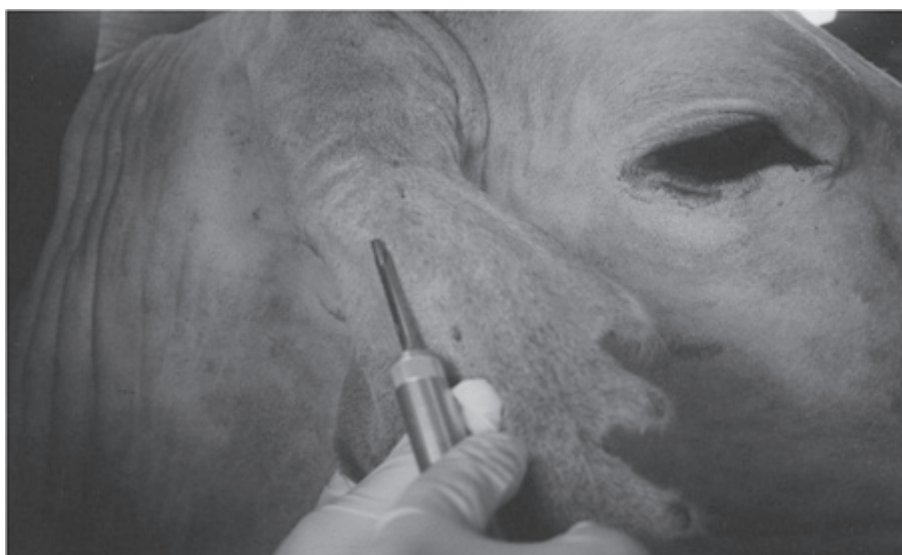
Figura 2 - Momento da aplicação do implante na orelha direita do animal

Como as IA foram realizadas em tempo fixo, a variável analisada foi a taxa de prenhez. Os dados foram analisados com o programa computacional Statistical Analysis System 8.0 16 . A taxa de prenhez, em proporção (resposta binária) foi analisada pela Regressão Logística. Os dados para a obtenção dos resultados foram analisados em duas categorias de resposta: prenhe/vazia. Foi utilizado nível de 5% de significância em todas as análises.