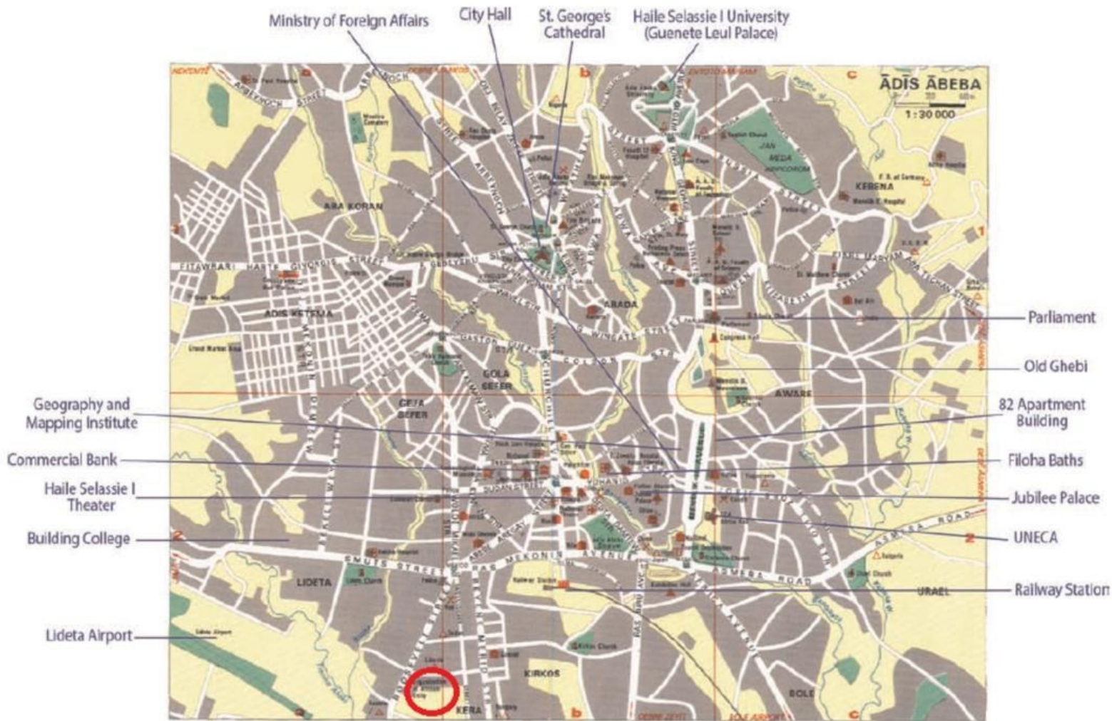
Mapa 1 – Mapa de ruas de Adis Abeba, início dos anos 1970 (Ethiopian Mapping Authority)