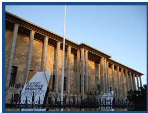
Figuras 2 e 3 – À esquerda: Palais de la porte Dorée com suas Colunas imponentes e seu baixo relevo ; À direita: Palais de la Porte Dorée