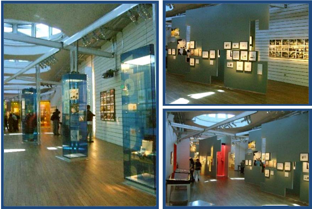
Figuras 6, 7 e 8: Exposição permanente Referências