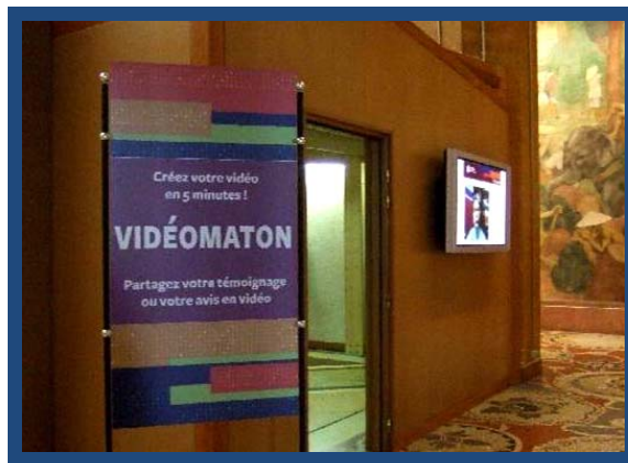
Figuras 4 e 5 - À esquerda: Antigo salon des fêtes – Fórum central da CNHI imigração; À direita: Cabine onde os visitantes podem deixar depoimentos sobre a imigração

Ao subir para o segundo andar do museu, o visitante encontra a exposição permanente “Referências”, bem como um espaço para exposições temporárias e a galeria de doações de objetos. Contudo, o visitante tem a sensação de que o museu realmente não preenche o espaço físico do prédio. Ou seja, há uma enorme lacuna entre o que é exposto e o edifício.