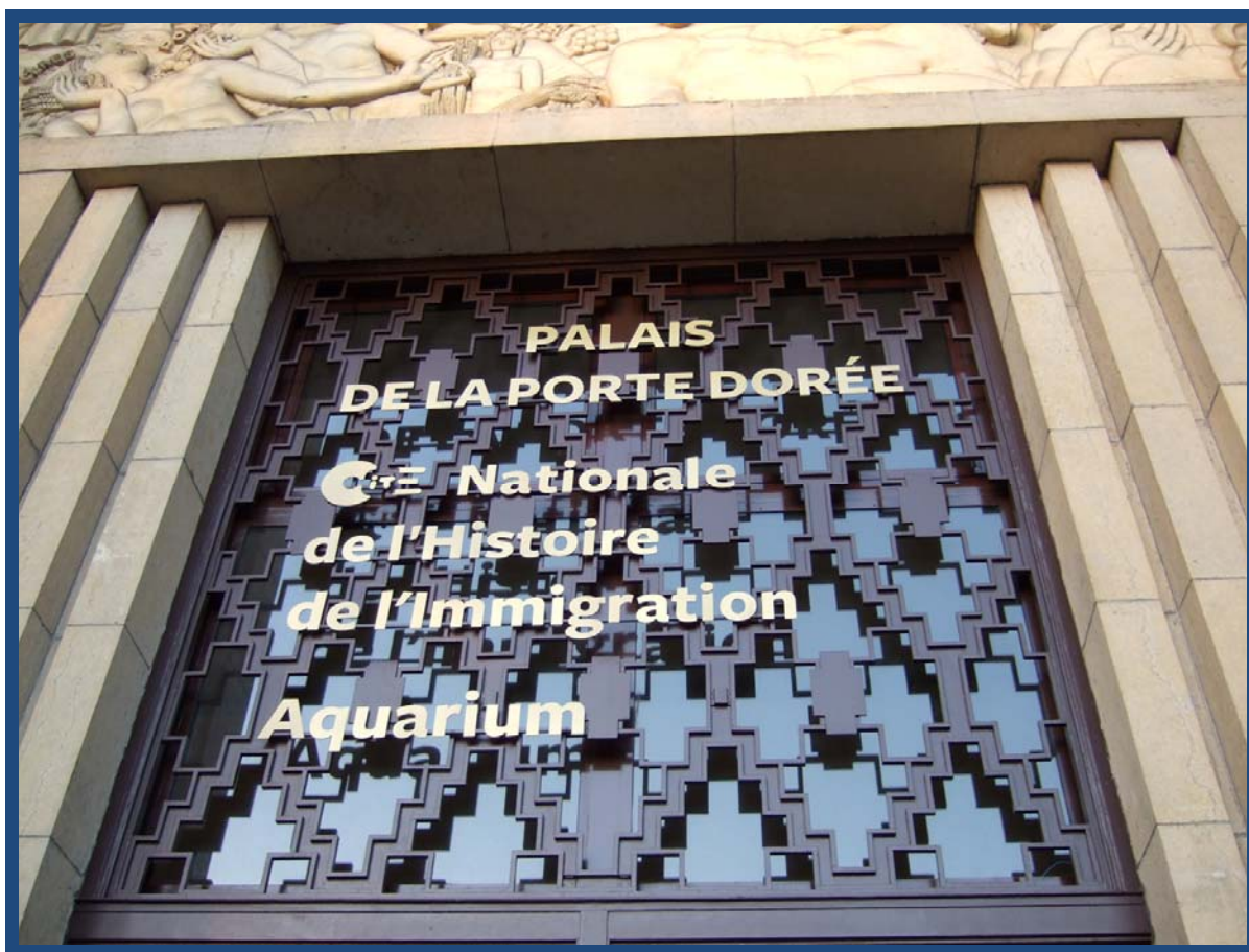
Figura 1 - Entrada da cité nationale de l'histoire de l'immigration