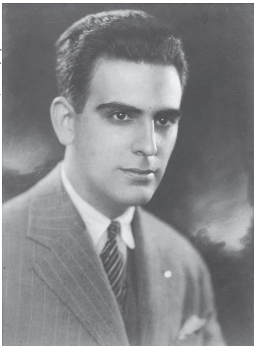
O editor José Olympio

O TÍTULO deste texto vem de uma lembrança antiga da minha mocidade, quando usávamos a expressão “das Arábias” para indicar uma coisa ou pessoa pouco comum e até mesmo extraordinária. Seria o caso de José Olympio.