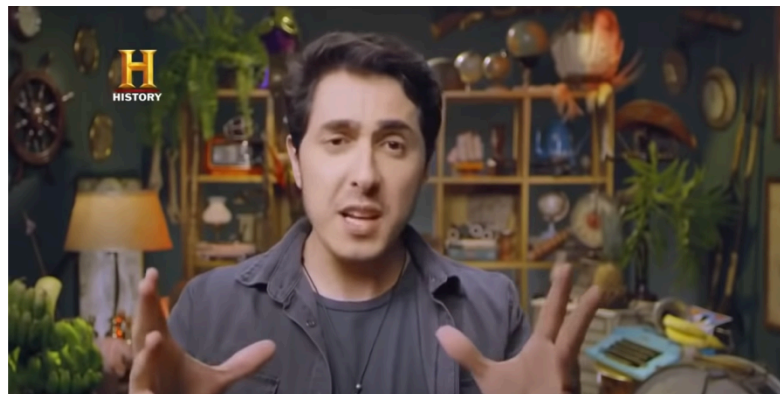
Imagem 6: Cenário de Castanhari na série Guia Politicamente Incorreto.