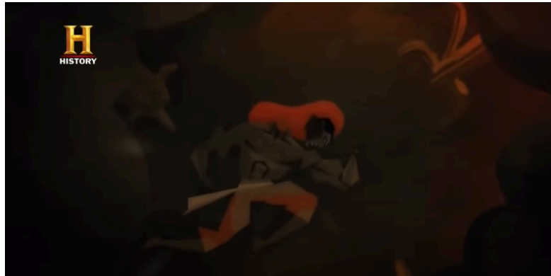
Imagem 3: Cena ilustrada da morte de Zumbi na série Guia Politicamente Incorreto.

atrativo para aumentar a audiência da série, em uma tentativa da produção de trazer os milhares de inscritos de seu canal para o canal do History .