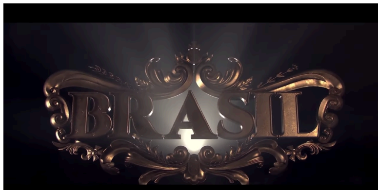
Imagem 9: Cena da abertura da série Brasil: A última cruzada.