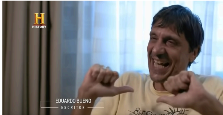
Imagem 8: O convidado Eduardo Bueno na série Guia Politicamente Incorreto.