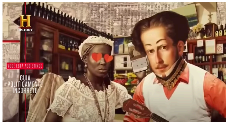
Imagem 4: Cena da abertura da série Guia Politicamente Incorreto.