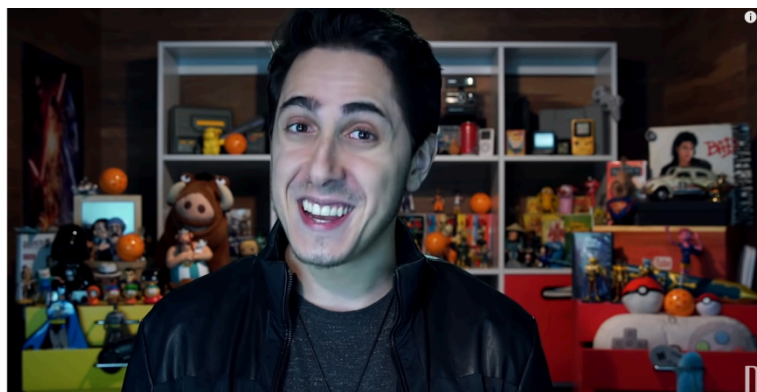
Imagem 7: Cenário de Castanhari em seu canal Nostalgia. Fonte: (Como Os Beatles mudaram a história da música - Nostalgia. Canal no YouTube Canal Nostalgia, 15/06/2017).