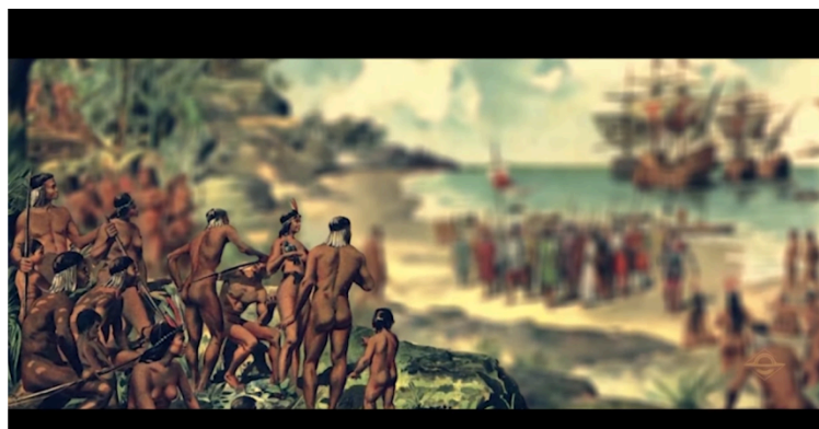
Imagem 10: Imagem para ilustrar contato entre indígenas e portugueses na série Brasil: A última cruzada.