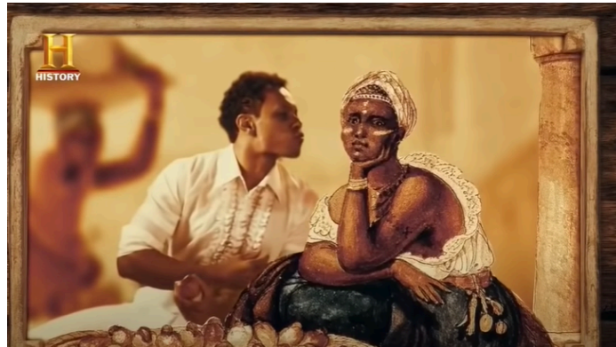
Imagem 5: Encenação dentro da obra de Debret na série Guia Politicamente Incorreto.