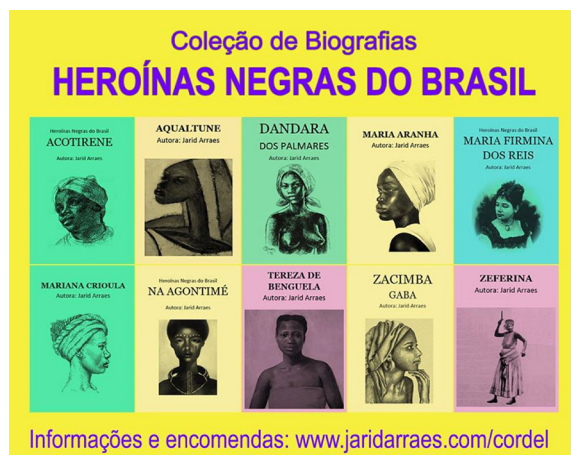
[Figura 2] – Imagem com dez capas de seus cordéis na página de Facebook de Jarid Arraes.