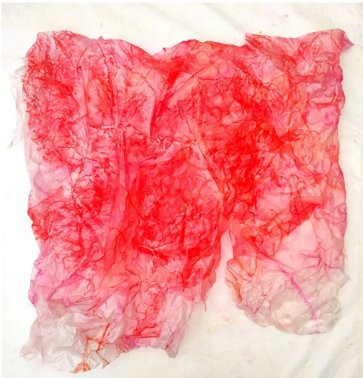
Fig. 11. Christina Elias, sem título (série Aéreos ), 2021. Giz pastel sobre papel vegetal, 145 cm × 98 cm.