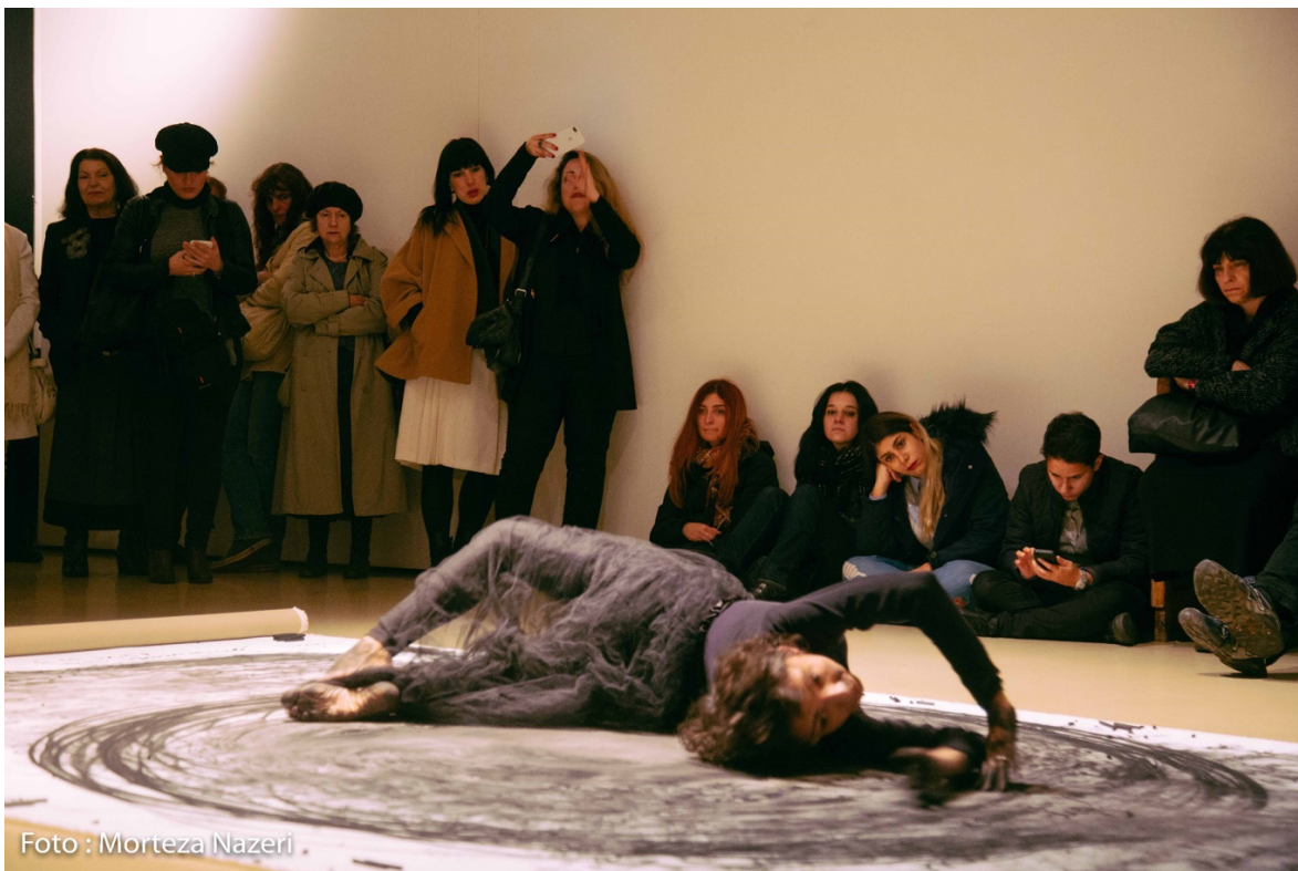
Fig. 2. Registro fotográfico da performance Caixa de Música . Morteza Nazeri, 2017.

Na performance Caixa de música 9 , Christina escreve em carvão o texto de um diário improvisado de dentro de uma tela de 2 × 4 metros. Coberta toda a tela, ou seja, quando acaba o espaço para mais texto, ela o borra, movendo-se com todo o corpo. E, então, recomeça a escrever uma outra página na mesma plataforma, a qual será novamente borrada pelo movimento do corpo, para ser reescrita e reescrita e reescrita ... As palavras, as frases, os sentidos e as imagens se rearranjam na obra e na pele da artista, criando novas e diversas possibilidades de narrativa, escritura e interpretação.