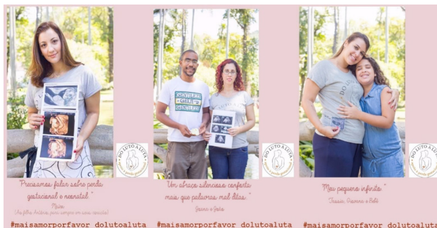
Figura 2. Fotos da campanha #maisamorporfavor

A via de mão dupla entre superação do luto e manutenção da identidade de mãe que perdeu um filho na barriga ou logo após o nascer é exemplarmente ilustrada na campanha fotográfica criada pela equipe Do luto à luta para sensibilizar a sociedade sobre a perda gestacional e neonatal. Na campanha #maisamorporfavor, pais, mães e seus filhos crescidos aparecem posando sorridentes junto à ultrassonografia de um bebê (Figura 2). Esse tipo de registro nos lembra a cena em que os membros de uma família pousam juntos para uma foto. Mas o gesto de exibir a ultrassonografia de um bebê causa estranheza.