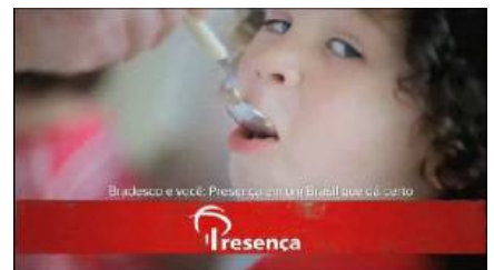
Figura 8 – imagem final da criança sendo alimentada pela merendeira: o discurso sobre a economia se apoia no uso estratégico dos afetos.

5. BRADESCO Árvore. Direção de Luis Pinheiro. São Paulo: Agência Neogama BBH/Equipe Mixer. Brasil, 2009. 90 seg, VHS, Son. Color. Disponível em: < http://www.youtube.com/watch?v=VpvYkbyXIR4&feature=channel_video_title >. Acesso em: 9 mar. 2011.