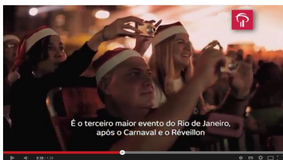
Figura 10 – o público assiste fascinado ao espetáculo de luzes e fogos de artifício da árvore do Bradesco.

A campanha Brasil Presença do Banco Bradesco, em nossa análise, revela-se um discurso construído de forma seriada, que estabelece encadeamentos internos a cada filme e em suas interdiscursividades. Nesta trama de significados, emergem sujeitos que são alinhados em um território demarcado pela presença da instituição bancária, como o grande elo invisível que rege o desenvolvimento do país. De acordo com Ferrara,