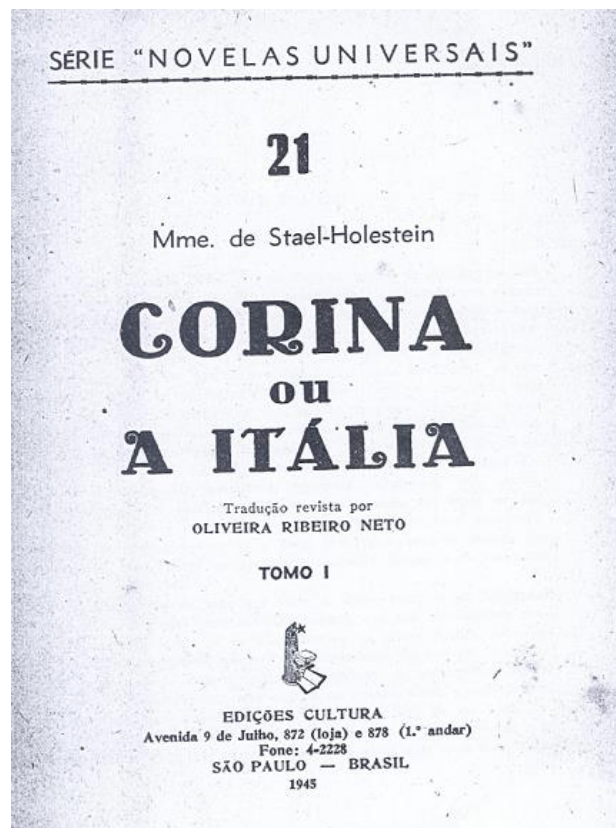
Figure 1 – Page de titre de la traduction Corina ou a Itália .

Pour conclure, nous pouvons affirmer que le choix de retraduire ce roman à travers un projet de traduction ne présuppose pas une forme absolue de traduire. On peut, par des approximations successives, s'approcher de l'original dans la traduction à chaque niveau : sémantique, stylistique, culturel, esthétique. Un aspect important consiste à éviter de tout adapter et clarifier, afin de préserver certaines qualités fondamentales de l'original. L'analyse du processus de traduction nous fournit un échange littéraire et culturel fécond qui devrait être accessible aux lecteurs, visant la diffusion et l'approfondissement des études littéraires et des études de la traduction. Nous soulignons que la retraduction enrichit le canon littéraire et par conséquent le système littéraire et culturel brésilien, avec la connaissance et l'étude de l'œuvre de Mme de Staël.