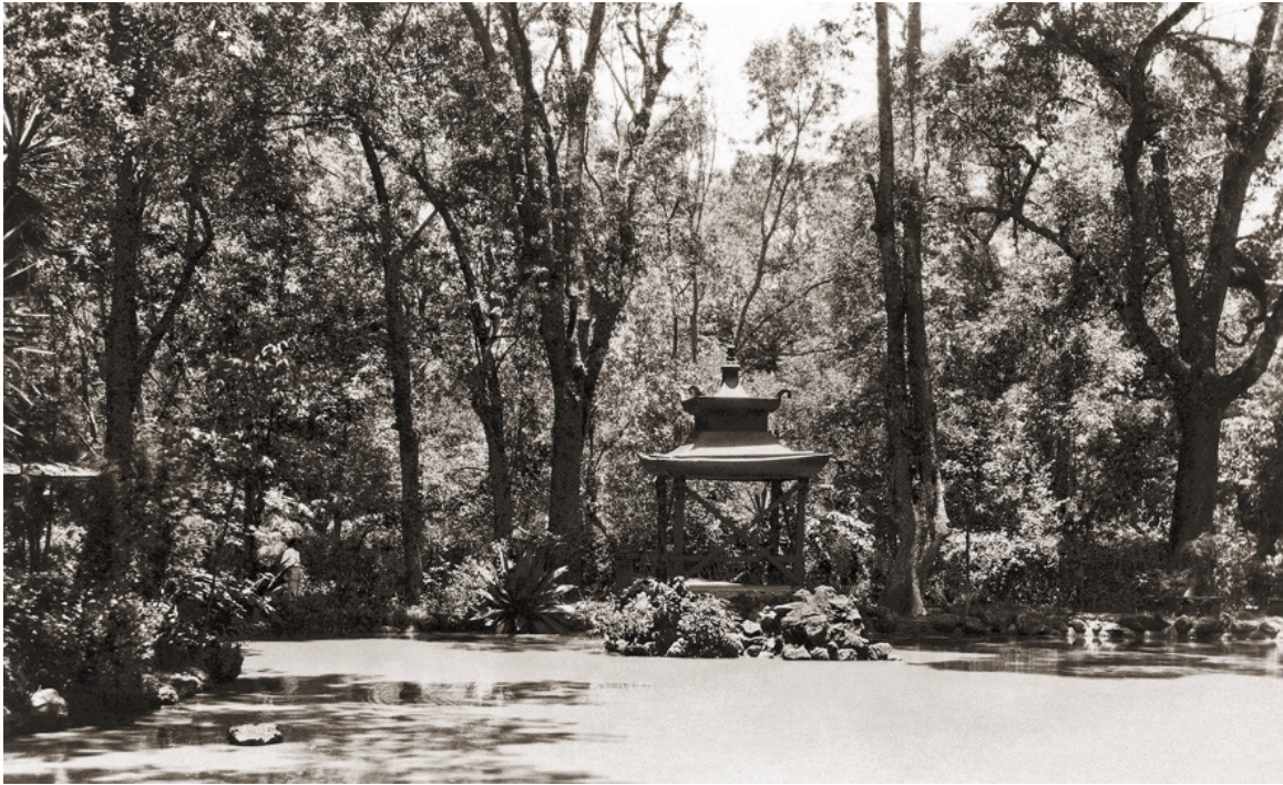
Figura 18 – Estanque con estructura a manera de pagoda.