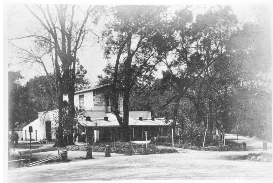
Figura 3 – Foto de Los Baños del 14 a principios del siglo XX. Foto: cortesía de José Macouzet Tron, sin fecha.