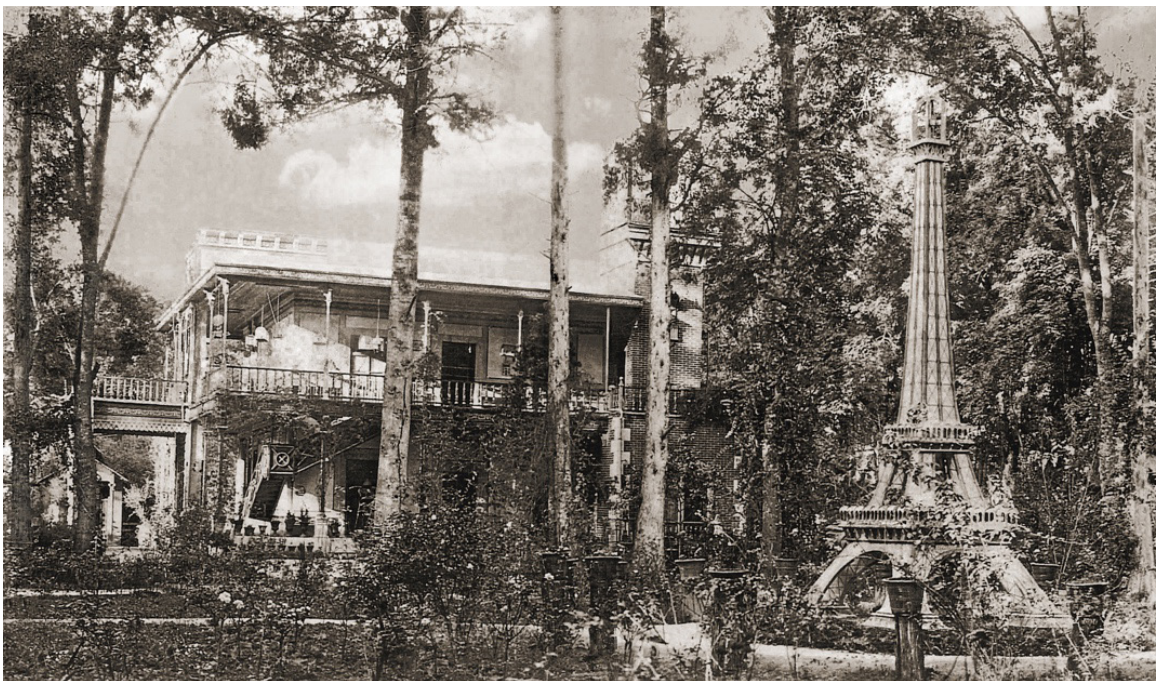
Figura 10 – El Jardín de Flora tenía una réplica de la Torre Eiffel. Foto: cortesía de Belén Figueroa Alvarado, sin fecha.

pequeños parterres para plantas de ornato a la escala del pequeño espacio. Fotografías muestran la delimitación del lote con setos, además de la densa vegetación de árboles que con su follaje cerraban el camino al cielo (Figura 13). En el interior del predio, el jardín se presenta con mayor orden que en el caso anterior, con parterres plantados de rosales y macetas idénticas posadas sobre un muro bajo (Figuras 14 y 15). La naturaleza romántica se nos presenta en una fotografía que muestra al pintor cortando rosas de una enorme mata que trepaba un árbol, mientras su esposa espera con el delantal abierto para recibir las flores (Figura 16).