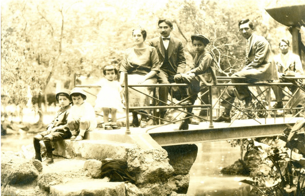
Figura 6 – Foto que muestra una familia moreliana en el Lote del Laguito.

moso expendio de tamales. Existe aún en el terreno un cenador realizado en concreto imitando la madera (Figura 7); esta estructura data de 1938 y es contemporánea a otras estructuras que usaban el artífice de imitar la madera y que fueron realizadas en la cercana ciudad de Pátzcuaro (TAPIA, 2018, p. 279).