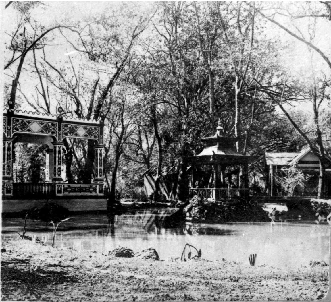
Figura 17 – Pabellón del Lote del Laguito.

manera de pagoda sobre unas rocas y otro pabellón abierto. En ambos se proporcionan espacios idóneos para el disfrute y contacto directo con el ambiente natural y, al mismo tiempo, una estética alejada de la cotidianidad moreliana (Figuras 17 y 18).