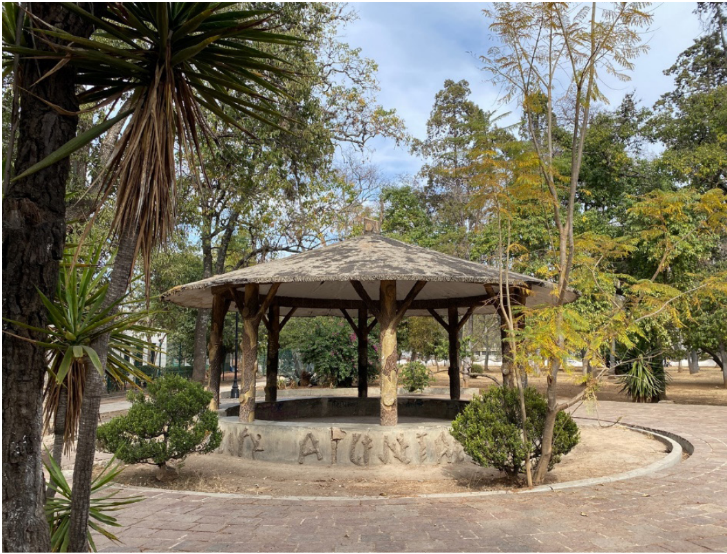
Figura 7 – El quiosco en el antiguo lote de El Jazmín. Foto: C. Ettinger, 2021.

quis muestra plantíos de flores (agapandos, rosales, violetas y alcatraces) siguiendo el contorno exterior del lote con árboles frutales al interior, incluyendo nísperos, ciruelos, limones, plátanos y perones, además de palmas (Figura 8) 14 .