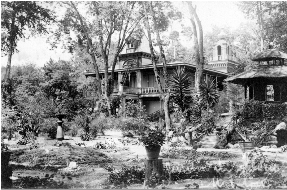
Figura 9 – Casa del Jardín de Flora inserto en un paisaje ecléctico. Foto: Archivo Fotográfico del IIH-UMSNH. Colección Gerardo Sánchez Díaz, sin fecha.