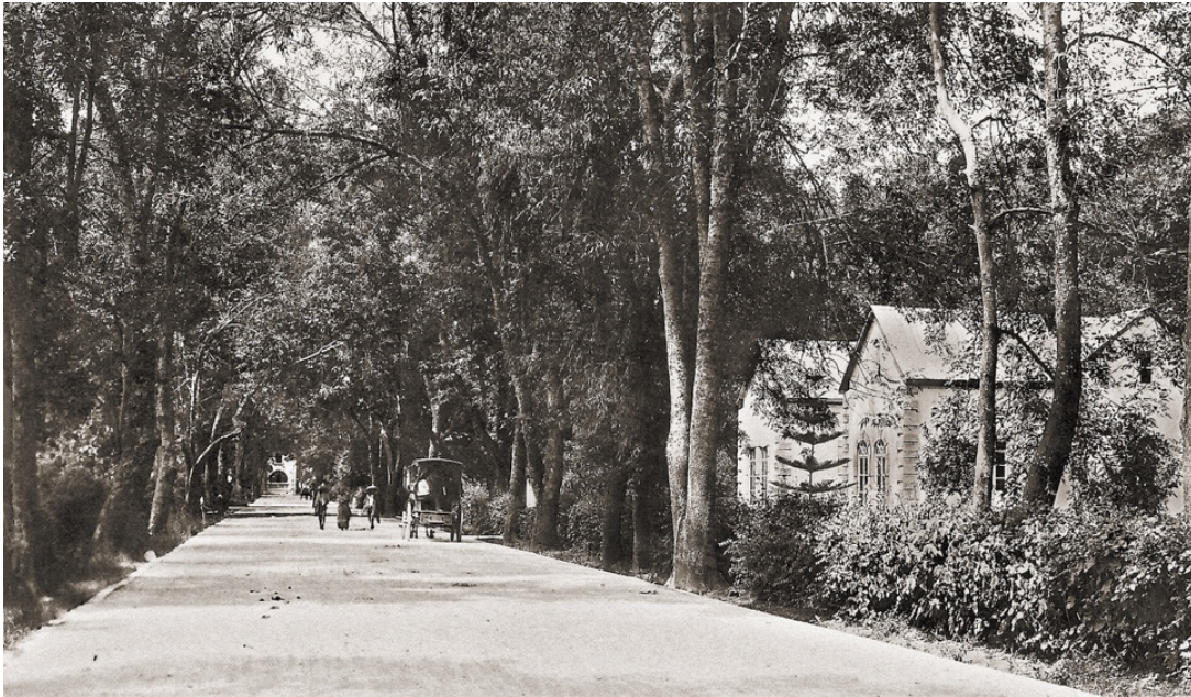
Figura 13 – Casa del pintor José Jara Peregrina en el lote 3 vista desde la calle.