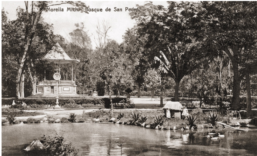
Figura 4 – El Lote del Laguito tenía una casita en miniatura. Foto: Archivo Fotográfico del Instituto de Investigaciones Históricas de la UMSNH (IIH-UMSNH), sin fecha.