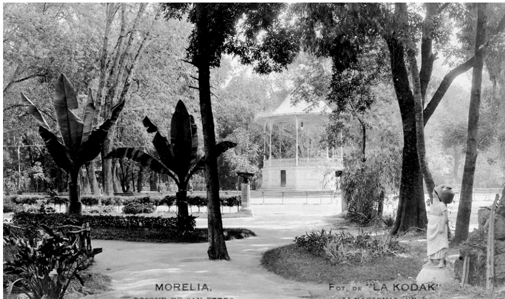
Figura 5 – Vista del quiosco central desde el Lote del Laguito.