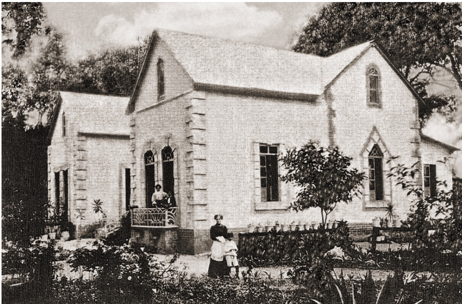
Figura 15 – Casa del pintor José Jara Peregrina en el lote 3.