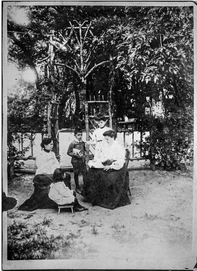
Figura 11 – Mujeres con niños al interior del Jardín de Flora. Foto: cortesía de Mireya Jara, sin fecha.