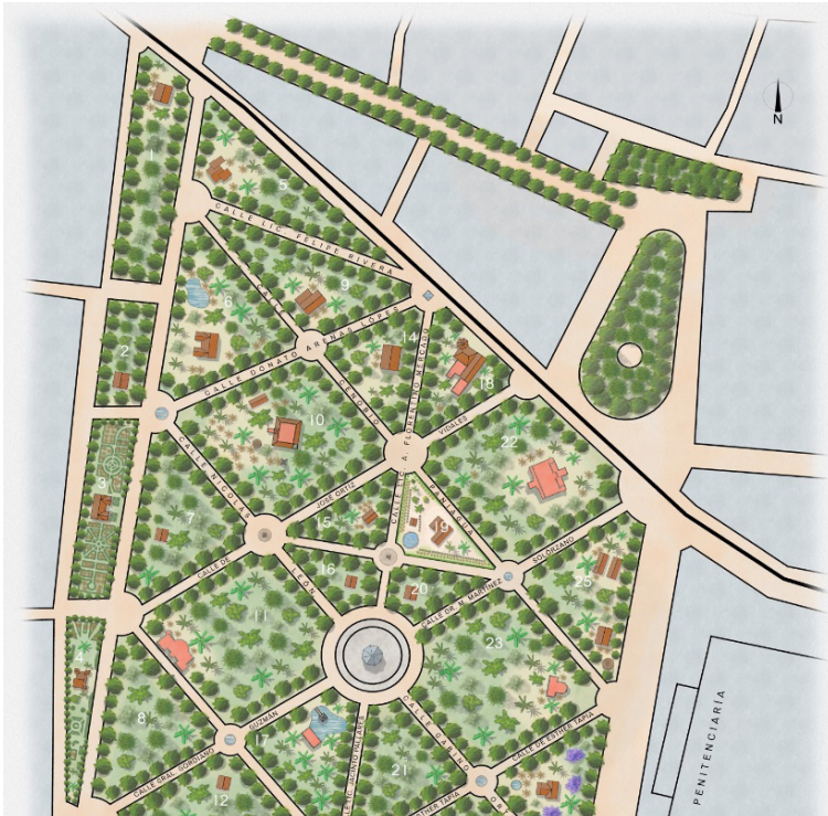
Figura 2 – Plano del bosque con una aproximación a la ocupación de los predios para mediados de los años 1930. Ilustración: Daniel García Barrera.