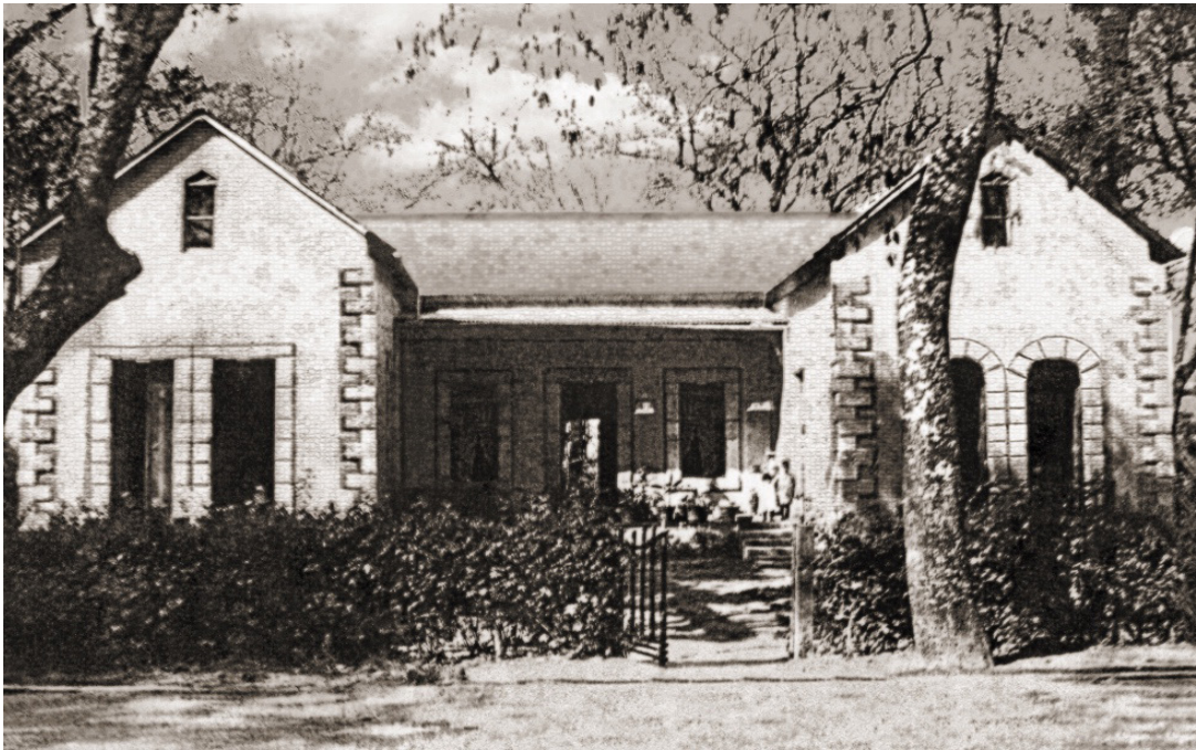
Figura 14 – Fachada de la casa del pintor José Jara Peregrina. Foto: cortesía de José Jara López, sin fecha.