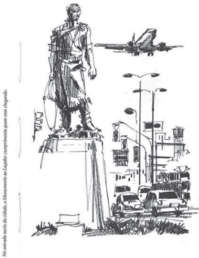
Figura 14 O Laçador no sítio original. Desenho: Joaquim da Fonseca. Fonte: Veríssimo (1996, p. 8).

mais ampla, a reflexão sobre a preservação dos marcos urbanos. Algo muito caro aos porto-alegrenses perdeu-se na transferência d'O Laçador . Como já mencionado, para os residentes que chegavam ou partiam, passar pelo monumento era o momento de sentir-se em casa ou despedir-se. Ali se concretizava a chegada à cidade ou a partida da mesma, pelo contato com a figura forte e expressiva do gaúcho de Caringí. Para os visitantes, era um sinal de boas-vindas, o momento de reconhecimento de um cartão-postal, uma afirmação do significado de estar na capital gaúcha. Essa identidade, reforçada pela proximidade do aeroporto Salgado Filho, é ilustrada na figura 14.