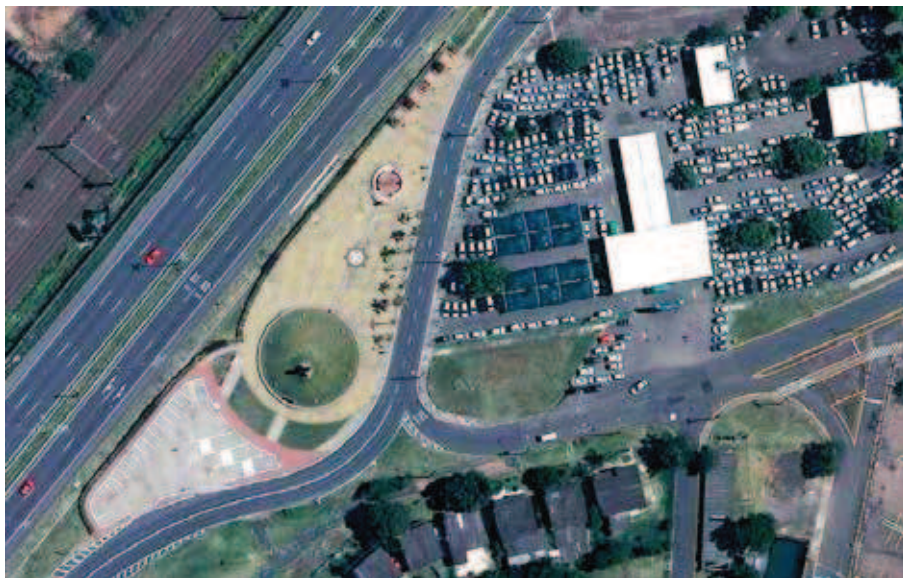
Figura 10 Vista aérea do Sítio do Laçador.

A escolha de um local próximo ao lugar original da escultura demonstra a preocupação presente no projeto no sentido de evitar mudança geográfica radical na localização da mesma. Segundo a prefeitura municipal, a obra contou com a aprovação de lideranças do Movimento Tradicionalista Gaúcho. (PORTO ALEGRE, 2007). Na figura 10, observa-se a vista aérea do novo sítio.