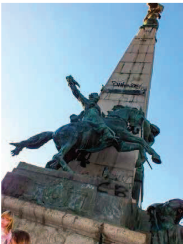
Figura 2 Monumento a Júlio de Castilhos. Fonte: Acervo dos autores – 31 mai. 2015.

artista Décio Villares 2 , inaugurada em 25 de janeiro de 1913 na praça Marechal Deodoro, apresenta em sua face posterior a estátua equestre de um gaúcho (figura 2). O monumento foi concebido para sintetizar a importância cívica e política de Júlio Prates de Castilhos, o primeiro governante republicano do Rio Grande do Sul.