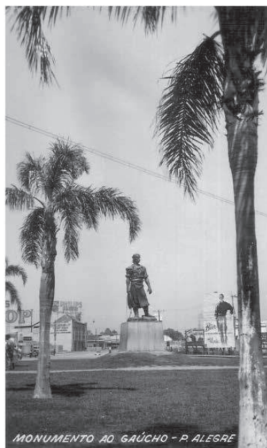
Figuras 6 e 7 Cartões-postais Canazaro – década de 1960.

Conforme análise e parecer do Conselho Municipal do Patrimônio Histórico e Cultural (Compahc), em 17 de setembro de 2001, o Monumento do Laçador foi inscrito no Livro Tombo nº 62 (página 2, vol. 2, Processo 1.016791.00.2) e passou a integrar o Patrimônio Cultural de Porto Alegre.