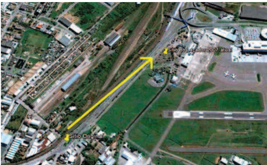
Figura 9 Deslocamento d'O Laçador.