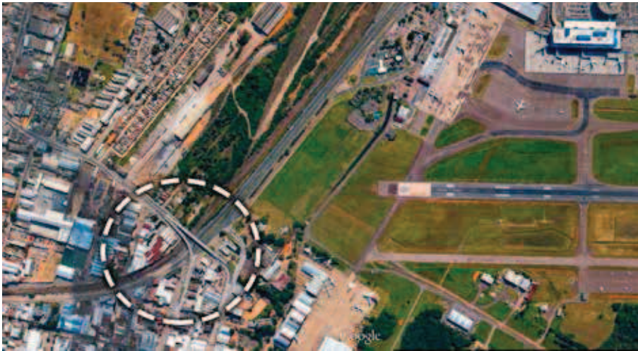
Figura 8 Viaduto Leonel Brizola.

A transferência do monumento realizou-se com o auxílio da instalação de cintas de poliéster afixadas na estrutura de sustentação, espécie de gaiola de aço, içando-o por guindaste e transportando por caminhão até o novo espaço destinado a recebê-lo. (PORTO ALEGRE, 2007). O deslocamento está ilustrado na figura 9.