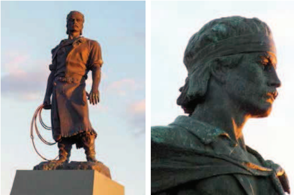
Figuras 4 e 5

de referência identitária da cidade. Segundo Alves (2004, p. 111): “Está para o estado assim como o Cristo Redentor está para o Rio de Janeiro; as Bandeiras de Brecheret para São Paulo; a estátua da Liberdade para Nova Iorque; a Torre Eiffel para Paris.”