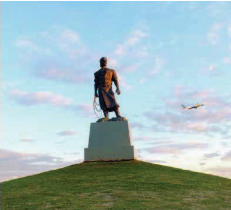
Figura 1 Monumento d'O Laçador. Fonte: Acervo dos autores – 31 mai. 2015.

No Rio Grande do Sul, forjou-se o “Mito do Gaúcho” [...] Este mito faz parte das manifestações do Imaginário sul-rio-grandense, alimentado pelo culto exacerbado às Tradições heroicas de uma História que continuamente “canta seus heróis em prosa e verso”, como uma necessidade atávica de afirmação e inculcação de um passado de glórias, criando-se o “orgulho de ser gaúcho”, mantendo assim uma identidade regional, resultante de uma construção social apaziguadora das grandes diferenças sociais existentes nos campos e nas cidades. (GUEDES, 2009, p. 53).