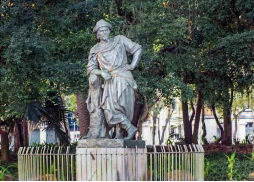
Figura 3 Gaúcho Oriental – Parque Farroupilha. Fonte: Acervo dos autores – 31 mai. 2015.

força do gaúcho como síntese dos ideais de um povo teve a sua expressão escultórica mais potente em O Laçador , de Antônio Caringi.