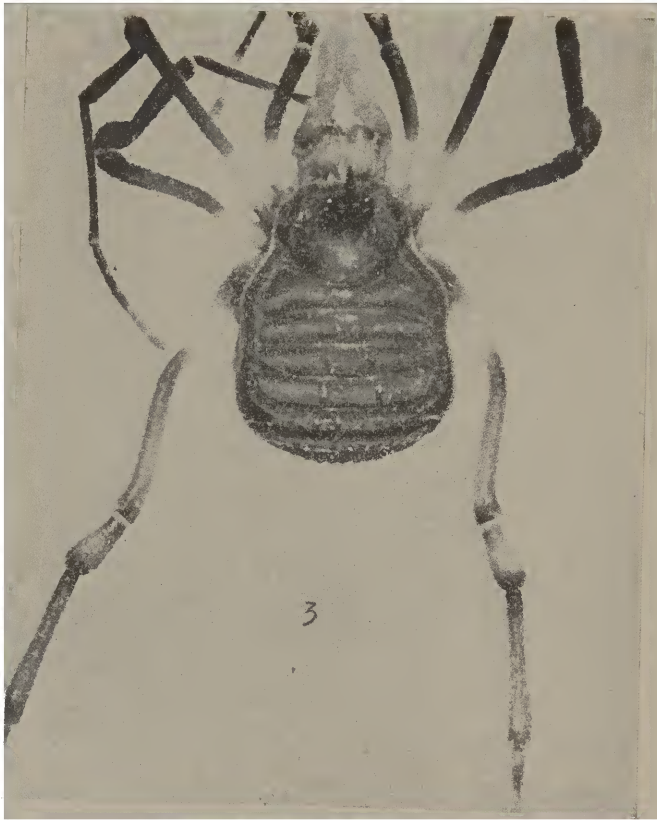
Caporiacoius fallax , sp. n.

escuras perto dos sulcos. Cômoro ocular escuro em torno dos olhos. Trocanteres de tôdas as patas amarelos. Tergitos e esternitos livres de tom castanho-escuro. Patas castanhas, com aneis enegrecidos no ápice dos fêmures e no ápice e base das patelas, tíbias e protarsos. Palpos amarelos.