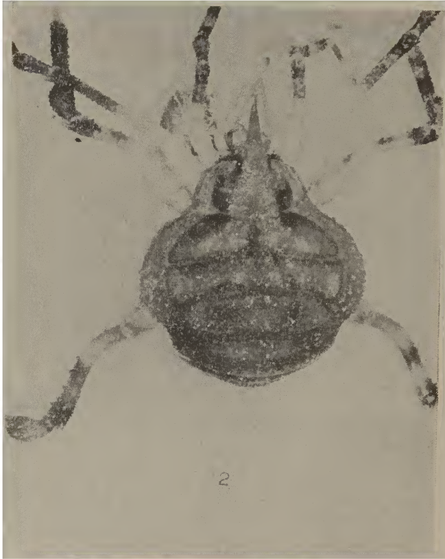
Oxyrhina zoppeii , sp. n.

nulos. Ancas, trocanteres, fêmures, patelas e tíbias de todos os pares de patas providos de tubérculos setíferos. Todos os fêmures, exceto os do primeiro par, armados de um espinho apical lateral. Fêmures I-II retos, III-IV curvos. Protarsos e tarsos providos de cerdas delicadas. Ancas I e II com dentes dorsais. Pal-