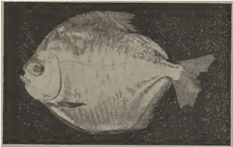
Metynnis roosevelti Eigenm.

D. 15-18; A. 36-43; serrilhado abdominal 31-42; cabeça 4; altura 1 1/4; diâmetro ocular 2 1/2 a 3 na cabeça; 2 no espaço interorbital; perfil superior e inferior simétrico de curvas regulares até o início da dorsal e da origem da anal, apenas uma ligeira depressão no perfil da cabeça; focinho curto 1/2 do comprimento do diâmetro ocular, peitorais atingindo as ventrais; origem da anal em frente o penúltimo raio dorsal; dentes das duas séries dos intermaxilares unidos; um par de dentes cônicos medianos