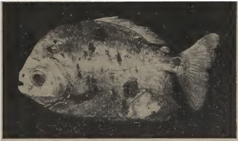
Tomète maculatus , n. sp.

D. 28; A. 36; serrilhado abdominal 33; olhos 3 1/2 na cabeça; 2 no espaço interorbital; 1 no focinho; altura 2; cabeça 3; corpo oval; não há concavidade entre os olhos; o focinho é arredon-