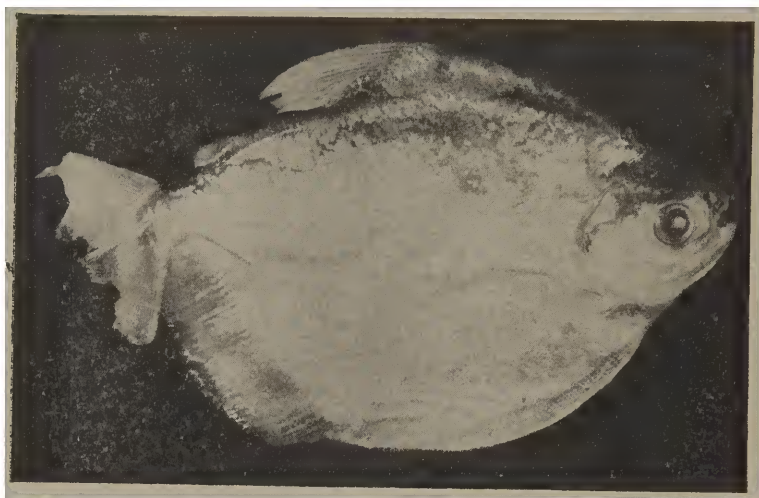
Mylossoma duriventre (Cuv.)

e 2 no espaço interorbital; dorsal situada na metade do comprimento do corpo; anal longa com a margem convexa, raios do último terço mais prolongados formando um lobo obtuso; adiposa curta; dentes intermaxilares da série posterior separados dos da