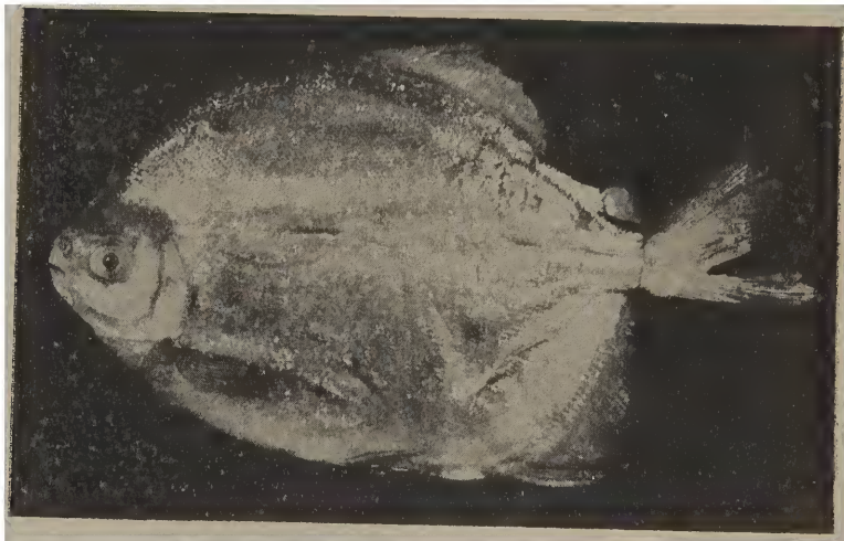
Myloplus asterias (Mull. & Trosch.)

D. I, 25-26; A. II, 35; serrilhado abdominal 44-45; cabeça 4; altura 1\frac{1}{3} ; escamas miudas, linha lateral completa sinuosa no início; espinho pré-dorsal presente; olhos 3\frac{1}{5} na cabeça; 1\frac{1}{9} no focinho; 2\frac{1}{3} no interorbital; opérculo redondo; mandíbula