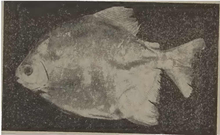
Myleus micans (Rhdt.)

D. 26-28; A. 36-39; espinhos abdominais 45-47; altura 1 1/3 - 1 1/2; cabeça 3 3/4; olhos 3 1/6; focinho pontudo igual a I diâmetro ocular, lábios finos mostrando os dentes; espaço interorbital 1 1/2 na cabeça; dentes das duas séries intermaxilares incisiformes e unidos. Ausência dos dentes medianos atrás da série mandibular. Dorsal com as pontas dos raios livres porém, não alongados, anal bilobada nos machos; caudal pouco furcada; adiposa curta; escamas pequenas, mais de 100 numa série longitudinal. Coloração prateada uniforme.