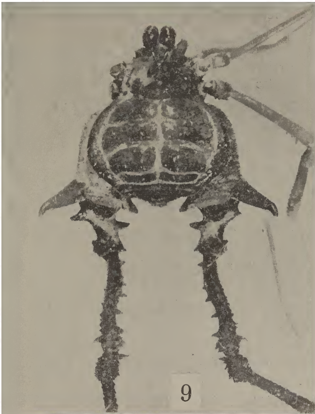
Fig. 9 - Discocyrtus sulcatus , sp. n.

vido de dois espinhos divergentes. Áreas I-II-III-IV divididas por um sulco longitudinal mediano, exceção em Discocyrtus . Área I com alguns grânulos, II com uma fila posterior de grânulos e mais alguns irregularmente distribuídos, III com um par de espinhos, granulosa, IV com duas filas de grânulos, a anterior de grânulos maiores, V com uma fila de grânulos. Tergitos livres