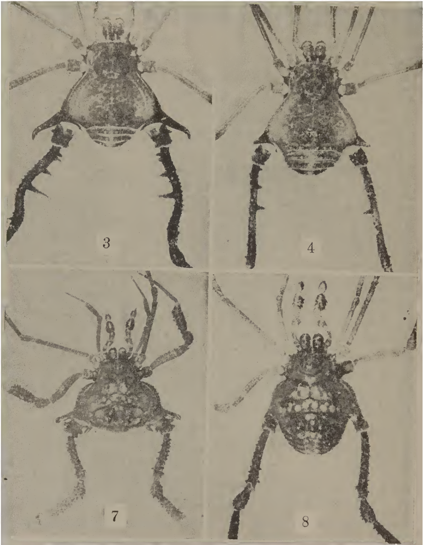
Figs. 3 e 4 - Gonyleptoides curvifemur , sp. n.