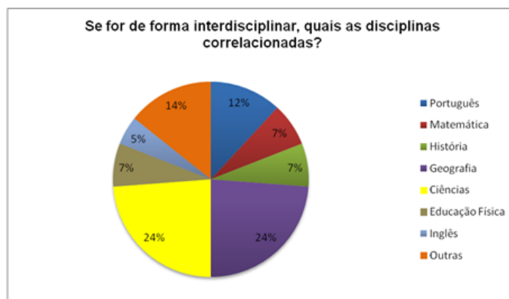
Figura 3 – Relação do tema EA com as disciplinas