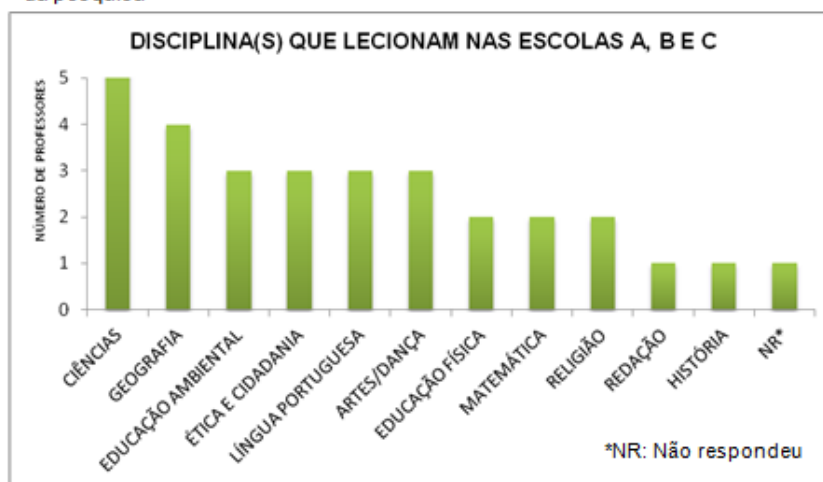
Figura 1 – Demonstração das disciplinas lecionadas pelos professores participantes da pesquisa

A maioria dos (as) professores (as) participantes da pesquisa leciona a disciplina de Ciências e Geografia (Figura 1).