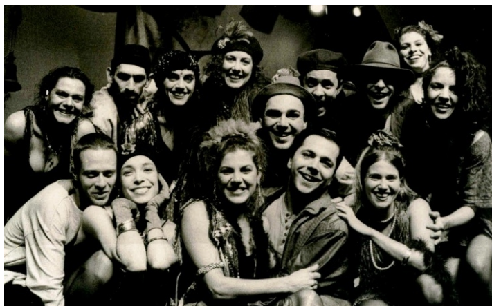
Elenco do espetáculo Teatro Cabaret Brecht. São Paulo, 1997.

supervalorizando o meu trabalho e tendo sempre uma real dimensão daquilo que eu era. Aprendi que um verdadeiro homem de teatro “não só tem de conhecer-se a si mesmo, como conquistar-se a si mesmo, assumir-se a si mesmo, converter-se naquilo que de verdade ele é.” (LAROSSA, 2006, p.35) Outra importante lição!