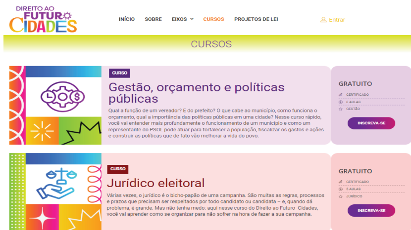
Figura 2. Print Screen da plataforma Direito ao Futuro. Área de Cursos. 2024. Disponível em: https://direitoaofuturo.com.br/cursos (Acesso em: 15/04/2024)

aprendizado e uma ementa clara. É possível também identificar no rodapé do site uma área que leva para a inscrição na Escola de Formação Política Sementes de Marielle, que não fica no mesmo site (é sediada no site Mulheres do PSOL).