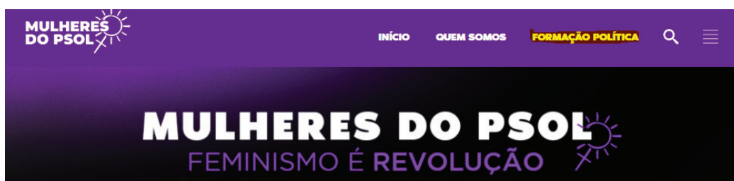
Figura 4. Print Screen da plataforma Mulheres do PSOL, 2024. Disponível em: https://mulheresdopsol.org.br (Acesso em: 15/04/2024)

Nas interfaces da ala feminina, tanto do Mulheres do PSOL quanto do PL Mulher, há uma identificação sobre educação e formação política. No primeiro, entretanto, essa área é uma inscrição para um curso que ainda acontecerá, não existe material já disponível para consumo imediato e nem um link que leve para a plataforma “Direito ao Futuro”.