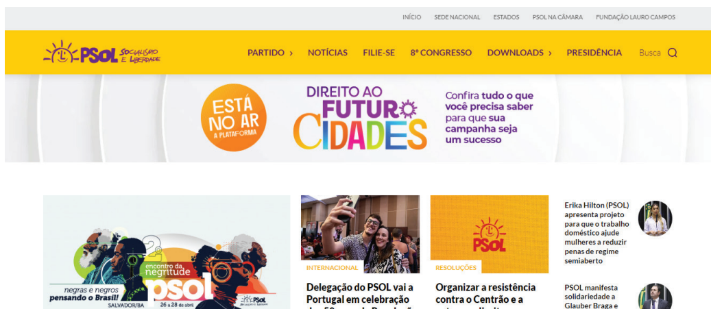
Figura 11. Print Screen da plataforma do PSOL, 2024.

A plataforma “Direito ao Futuro” busca unificar a educação digital do partido, mas há uma falta de integração prática entre o PSOL e seus programas de formação. Ao comparar os cabeçalhos dos sites do PSOL e do PL, nota-se que o PSOL não possui uma seção dedicada para arquivamento de cursos ou palestras, ao contrário da Academia Conservadora do PL e do PL Mulher. A “Direito ao Futuro” é apresentada como um banner temporário que direciona para uma plataforma de cursos fora do site principal do PSOL, com uma interface diferente do Mulheres do PSOL, causando uma sensação de descentralização e dificultando a percepção de unidade entre as iniciativas educacionais do partido.