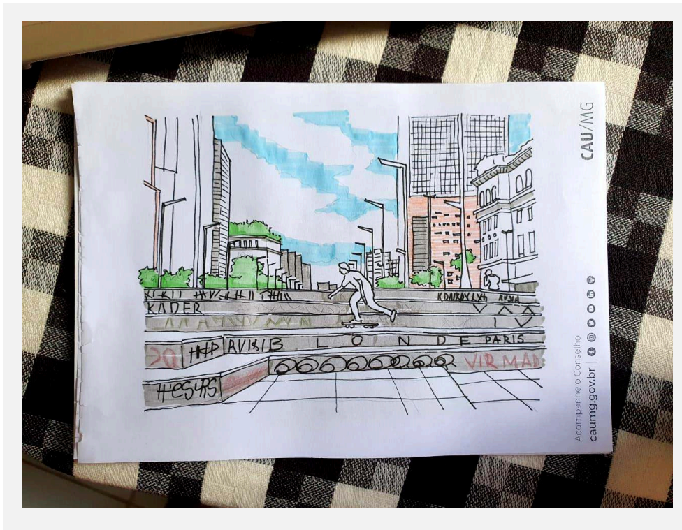
Imagem 6 - Vista parcial do Memorial do Skate.