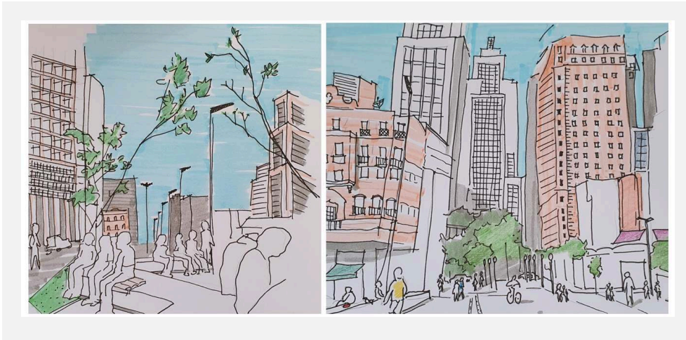
Imagem 5 - Desenhos do Vale do Anhangabaú.

permeada por muitas controvérsias, algo decorrente, também, da metodologia empregada no planejamento, qual seja, a de uma “cidade para pessoas”, capitaneada pelo arquiteto urbanista dinamarquês Jan Gehl. Objetivava-se garantir, através de uma inversão de escala, um ambiente acolhedor para pessoas de modo que fomentasse as suas permanências no local. Contudo, a crítica feita se deve ao fato do planejamento ter preterido das intenções certas pessoas, como as mais vulneráveis que historicamente ocupam o centro. Este desprezo, portanto, apenas realocaria as desigualdades: por um lado a região teria a frequência de um novo público consumidor, porém aqueles que padecem pelas misérias urbanas continuariam ignorados ou combatidos.