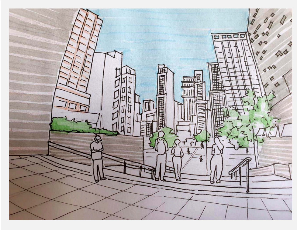
Imagem 4 - Passagem da Praça das Artes para o Vale do Anhangabaú.

de concentrar funções ligadas à arte e à música, o que impõe um caráter mais enobrecido ao conjunto.