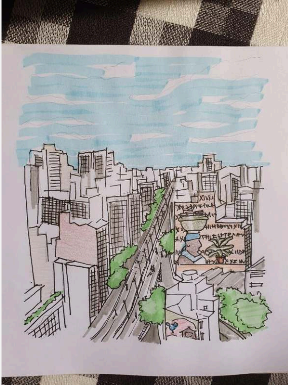
Imagem 2 - Vista parcial do Minhocão.

parede que trazia a imagem de dois punks, cada qual com referências, em suas respectivas jaquetas, a bairros paulistanos (Sacomã, Campos Elíseos, Ipiranga, Glicério, Grajaú, Vila Anglo) e a cidades da baixada santista (Praia Grande e Santos). Tais artes afirmam formas de cidadindade (pichação e movimento punk), bem como indicam a constituição de circuitos que se ampliam desde as periferias, e até mesmo de cidades alhures, para esta centralidade.