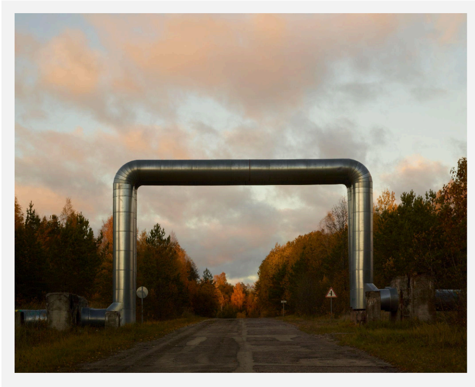
Imagem 2: Tubulação conectando a cidade e a usina.