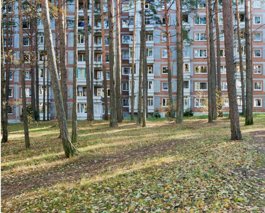
Imagem 1. Trilhas que cortam a cidade.

próximas a fontes de energia nuclear, carvão e ferro (Cinis et al., 2008). Fundada em 1973, a usina de Ignalina deveria ser a maior da União Soviética e estaria à altura de fornecer energia às crescentes necessidades da região. Ela começou a operar em 1983. A construção de Sniečkus foi ordenada pelo Comitê de Energia Atômica da URSS e foi planejada pelos célebres arquitetos soviéticos Akulin e Belyi, que já haviam trabalhado em outras cidades atômicas, incluindo Sosnovyi Bor e Shevchenko.