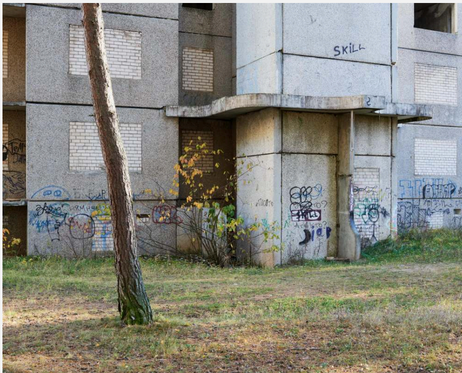
Imagem 3: "Suicídio".