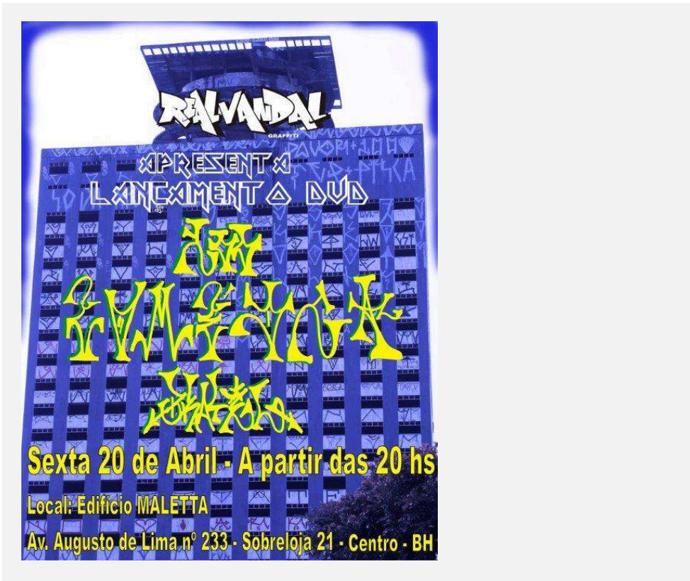
Imagem 4 - Cartaz de lançamento do DVD 100 Comédia Brasil, com o cartão postal da pixação mineira ao fundo.