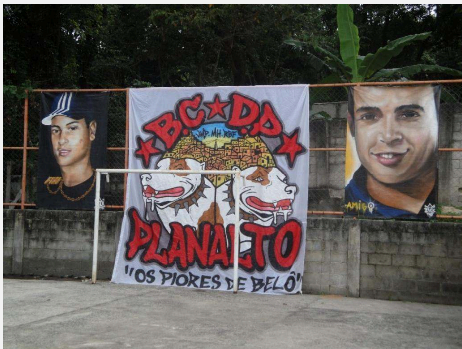
Imagem 3 - Bandeiras expostas nos fundos da quadra, durante a festa da BN.

presente nos muros, marquises e viadutos de Belo Horizonte. Por conta disso, ainda que nossa interação tenha sido bem rápida, tal experiência para mim foi bastante marcante. Pelo fato deste pixador ser cadeirante, rapidamente me prontifiquei, junto com outro pixador que o acompanhava, a ajudá-lo a descer o alto desnível que separava a área do churrasco da festa da quadra poliesportiva, pois I. gostaria de ir até as proximidades do painel. Depois disso, A. marcou a sua inscrição, e fez questão de – tal como faz nas ruas de Belo Horizonte – marcar a preza de I., seguida de um desenho que representa um cadeirante.