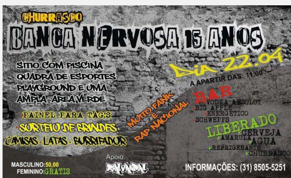
Imagem 1 - Convite da Festa Comemorativa do Aniversário de 15 anos da galera Banca Nervosa.