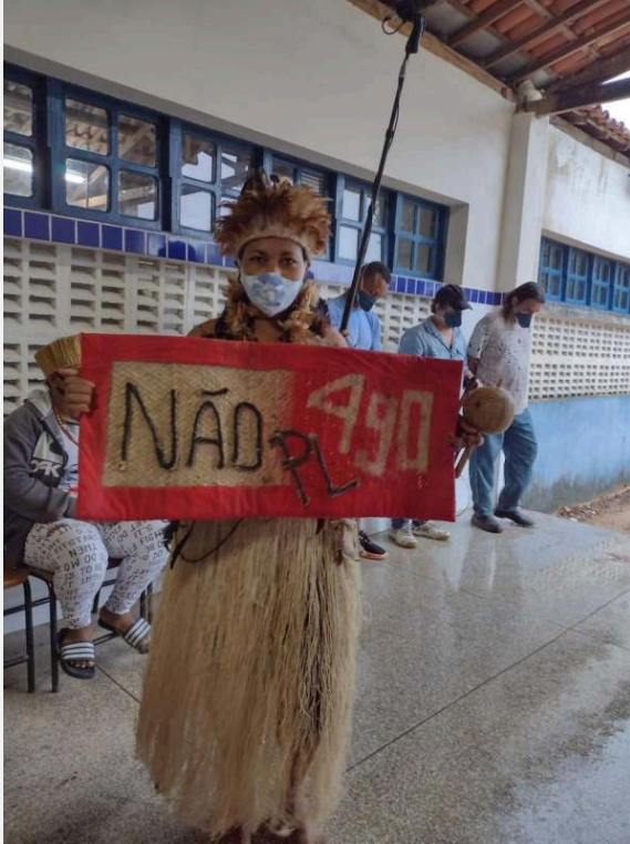
Foto do acervo de Magna Kaimbé tirada durante os protestos ocorridos em Massacará/BA em junho de 2021.