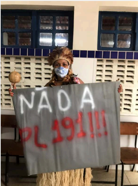
Foto do acervo de Magna Kaimbé tirada durante os protestos ocorridos em Massacará/BA em junho de 2021.