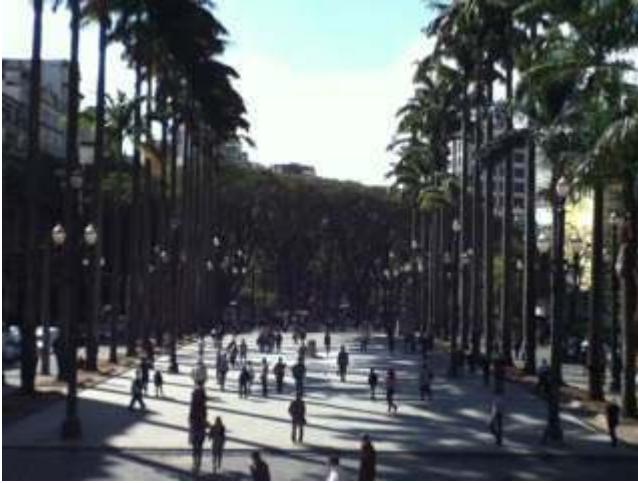
Figura 1: Foto tirada da escadaria da Catedral da Sé. 18/07/2012