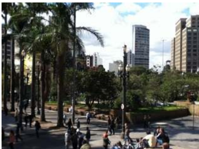
Figura 3: As “muretas”, ao lado da Catedral da Sé. 18/07/2012