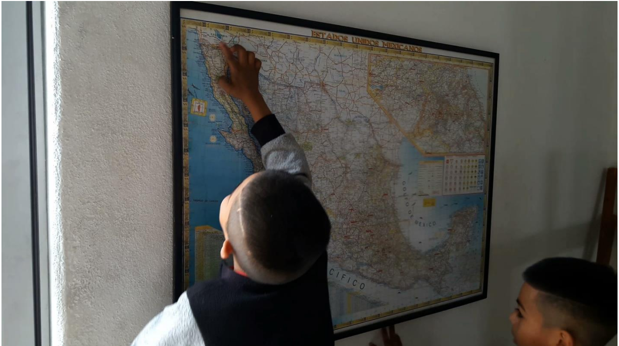
Crianças hondurenhas em trânsito apontam a fronteira México-EUA durante sua estada no albergue Casa del Migrante de San Luis Potosí . Maio de 2017.

“ retornados ” 8 : eles cruzam a ponte 9 e o primeiro que se lhes fornece é um documento de identificação temporário.