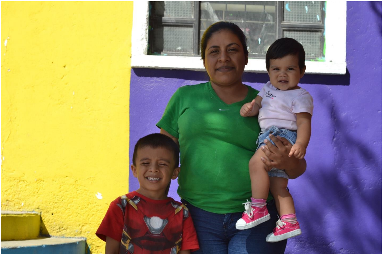
Família salvadorenha em estada na Casa del Migrante de Saltillo a espera de uma resposta a seu pedido de asilo à Comisión Mexicana de Ayuda a Refugiados, COMAR , do estado de Coahuila, no norte do México. Abril de 2017.

S. G. – Para mim, o que me alegra nessa relação, volto a dizer, é essa ideia da população que compartilhamos. Essas crianças que estão chegando ao México e que são cidadãos estadunidenses, quando completarem dezoito anos, escolherão onde viver. Eles poderão votar nos dois países. Como meu filho uma vez me perguntou: “Então, eu posso ser presidente dos dois países?”. “Sim”, eu respondi.