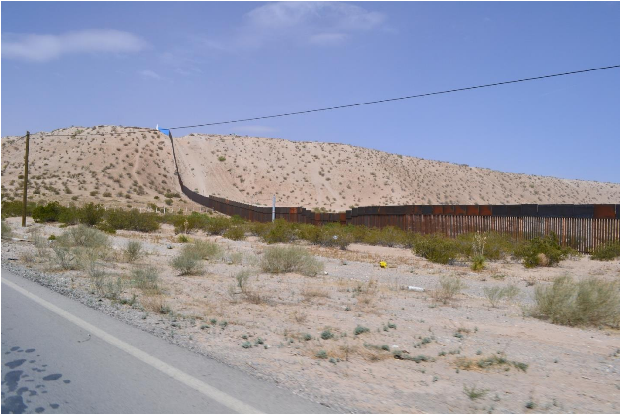
Imagem do cercado fronteiro no bairro de Anapra, na Ciudad Juárez, uma das rotas de cruze utilizadas pelos migrantes que tentam alcançar o sonho americano . Abril de 2017.

S. G. – Como mencionei antes, é muito contraditório por que fazem uma lei fundamentada na abordagem dos Direitos Humanos e, ao mesmo tempo, fazem o Programa Frontera Sur . É pouco congruente. As instituições responsáveis pelo tema migratório têm muitas denúncias por violação aos Direitos Humanos, recomendações da Comisión Nacional de los Derechos Humanos (CNDH) no México, e eu vejo pouca mudança. Há uma inércia administrativa que não sabem como modificar.