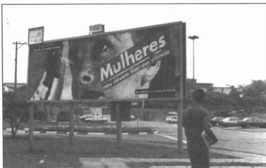
Outdoor de Barbara Kruger, Cidade Universitária — USP, 1992

Mais do que a fugacidade do tempo, a relação imagem/texto aí adulterada pela intervenção artística subverte qualquer possibilidade de identificação.