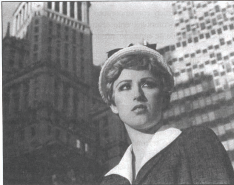
Sem título (Cena de Cinema Nº 21, Cindy Sherman), 1978

A fotografia é o meio privilegiado de operações para artistas como Sherrie Levine que brinca com a sacralização da autoria, com o falso e verdadeiro da criação, fotografa obras de outros artistas e coloca sua assinatura. Cindy Sherman cria personagens para si mesma, fotografa incessantemente suas inúmeras personas que vão de anônimas bibliotecárias, domésticas, passando por personagens de filmes norte-americanos da década de 50 cheias de glamour , ou ainda figuras saídas das telas de pintores clássicos. O tempo e o espaço são abstrações para as falsas construções que faz de si mesma.