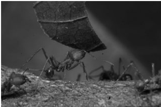
Operárias transportando um pedaço de folha. Cada operária cumpre uma parte do que precisa ser feito (Figuras 2A-2D) e a colônia sobrevive graças a uma harmoniosa divisão do trabalho (Fotos de Joana Fava Alves).