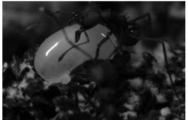
Babá cuidando de uma larva.