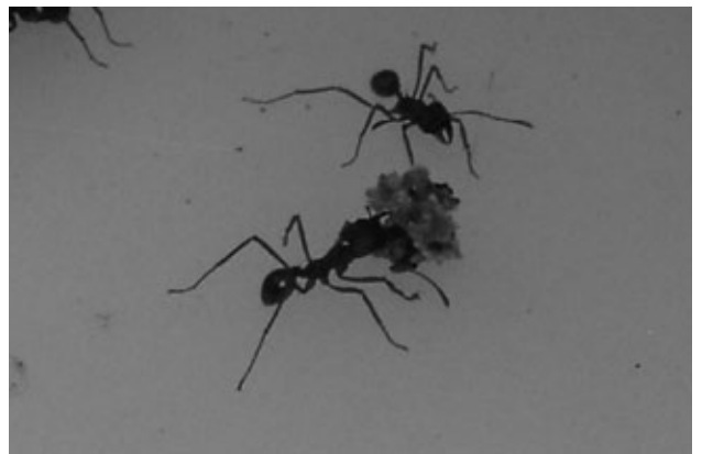
Lixeiras transportando fungo.