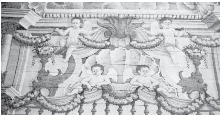
Ilustração III - Detalhe da pintura do forro da capela-mor. Igreja de São Gonçalo do Rio das Pedras in: DEL NEGRO, Carlos. Nova contribuição ao estudo da pintura mineira (norte de Minas) . Rio de Janeiro, MEC/IPHAN, 1978. Foto 118.

modelos iconográficos das mais variadas origens. Essa era a base do aprendizado na “oficina”. Parece mais adequado falar em pintura diferente e graciosa para o período colonial brasileiro e reservar o termo “original” para os estudos dos manifestos modernistas.