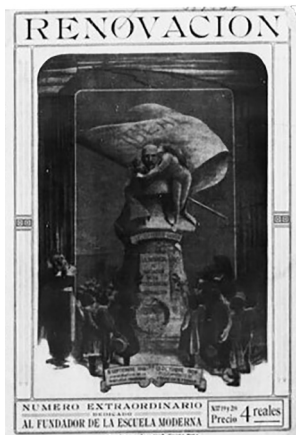
Figura 12 Capa Renovación