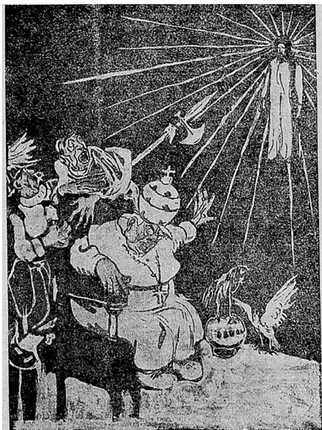
Figura 18 Ofuscados por Cristo