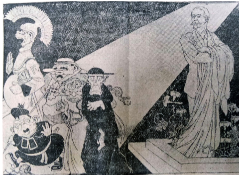
Figura 19 Ofuscados pelo mito Ferrer