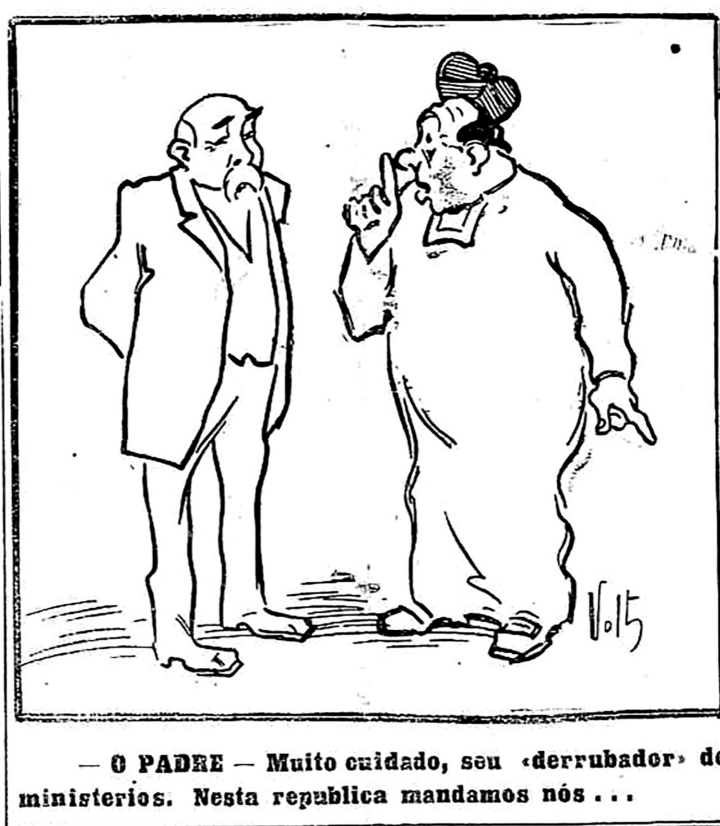
Figura 16 Ferrer e o padre