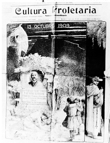
Figura 14 Capa Cultura Proletaria