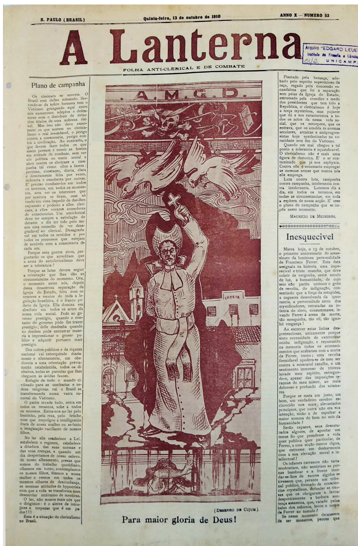
Figura 3 Capa da edição especial de 13/10/1910

conveniente, a caricatura permite que a equiparação seja ampliada a ponto de tornar-se uma fusão visual. Conforme explica o historiador, “muitos oradores devem ter chamado muitos ministros de ‘parasitas’, mas tornar a identidade visível é outro caso” (GOMBRICH, 1999, p.135). Em A Lanterna , o tempo todo são atribuídos aos clericais adjetivos como malignos, vis, cruéis e manipuladores, o que a obra de Voltolino faz é justamente esse tornar visível por meio da representação gráfica.