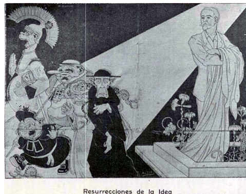
Figura 20 Ressurrecciones de la Idea