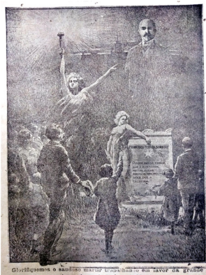
Figura 9 O mártir Ferrer