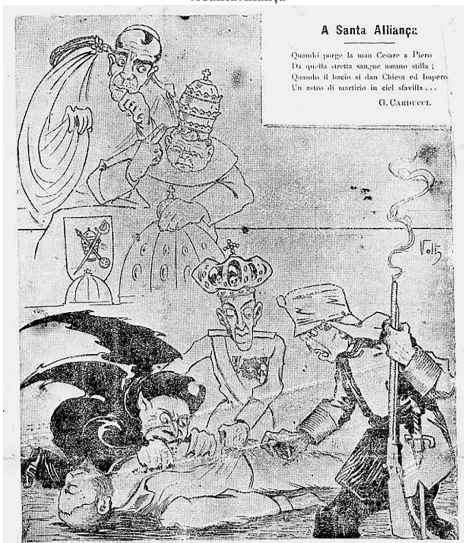
Figura 2 A Santa Aliança

média” é um jogo de palavras que satiriza a situação: a tragédia da morte de Ferrer, fruto de uma decisão autoritária do rei, sob o controle do Clero – joga com o imaginário da relação entre eterno e divino e atribui a decisão pela morte de Ferrer a uma atitude inquisitorial da Igreja. Já a legenda, disposta de maneira a soar como uma frase do rei a seu subordinado, reforça que a demissão de Maura não passava de uma estratégia da monarquia católica da Espanha para atenuar a pressão da população sobre o governo após os acontecimentos da Semana Trágica.