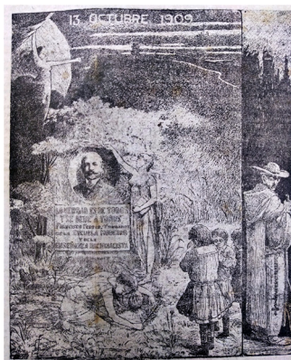
Figura 10 13 de outubro de 1909