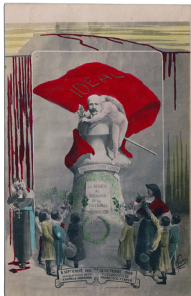
Figura 11 Postal colorizado