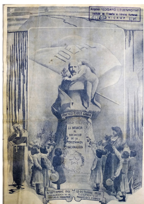
Figura 8 Ideal

Outra linha de representação iconográfica de Ferrer é a que o coloca enquanto um mártir da educação popular e do operariado. Em A Lanterna , muitas das imagens que representaram o professor na condição de mártir foram publicadas nos números que o homenagearam pela ocasião da efeméride de 13 de outubro. Para a presente análise, chama-se a atenção para três ilustrações que foram publicadas em capas de edições que rememoraram Ferrer y Guardia, respectivamente, nos anos de 1911 (Figura 8), 1912 (Figura 9) e 1914 (Figura 10).