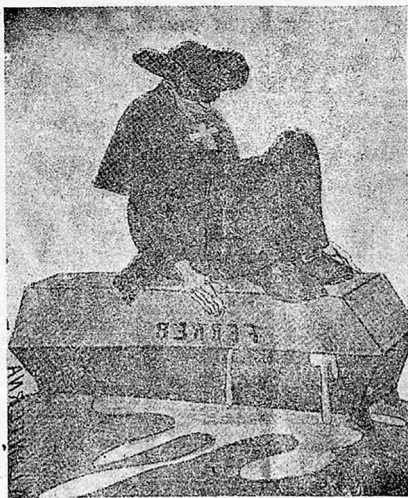
Figura 4 O que domina na Espanha O que domina na Hespanha

Assim, em consonância ao discurso anticlerical, a imagem chama a atenção para o papel do Clero como principal responsável pela morte do educador, deixando o rei espanhol apenas em segundo plano. Ademais, estão aí presentes vários dos elementos discutidos até agora como componentes da simbologia do complô, transmitindo e difundindo essa mensagem de maneira visual. De forma bem mais simples e direta, esta é a mesma ideia passada pela Figura 4.