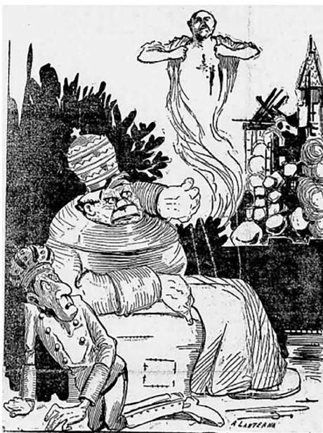
Figura 17 As chagas de Ferrer

Interessante notar que a intervenção dos editores do periódico, ao adicionarem à ilustração de Voltolino a referida legenda, insere o mito Ferrer no contexto da política brasileira – o ministério a que se refere o padre é o de Antônio Maura, mas a república é a do Brasil, em uma evidente crítica do jornal ao poder exercido pela Igreja nas questões estatais. Assim, na véspera da primeira efeméride em comemoração ao educador ele já não aparece apenas como vítima. De postura ativa e tranquila, Ferrer é representado aqui como o personagem-símbolo, guia revolucionário na luta contra o complô clerical.