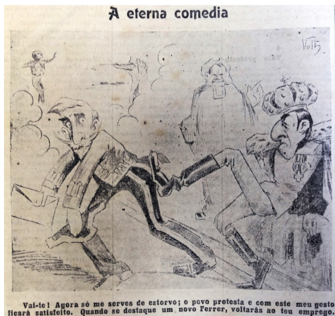
Figura 1 A eterna comédia

Na iconografia sobre Ferrer veiculada no jornal essa representação do Clero como um complô maléfico que teria o controle sobre as ações dos governantes também aparece com frequência. Na terceira edição do periódico, ainda comemorando a deposição de Maura, A Lanterna publica na folha de capa uma ilustração que intitula “A eterna comédia”.