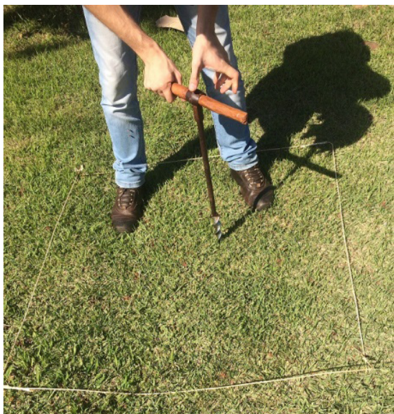
Figura 4 – Coleta para posterior análise de solo. Fonte: próprios autores.

Análise química do solo: Para cada local foram retiradas amostras de três pontos, escolhidos aleatoriamente, dentro de um metro quadrado cada (Figura 4).