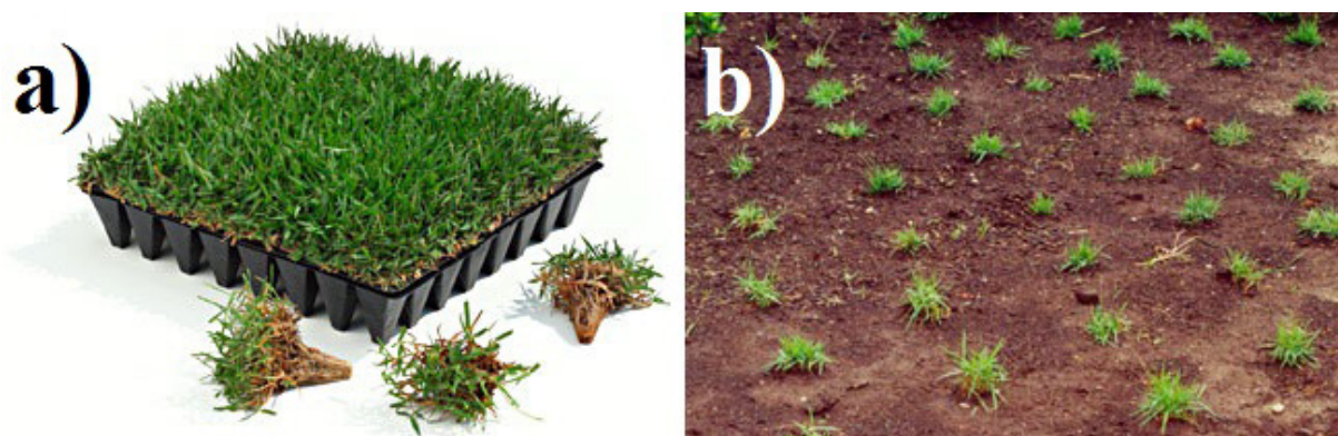
Figura 1 – Plugs dispostos em bandeja (a) e plugs implantados em jardim (b).

redução de até um terço no capital envolvido. O tempo de formação de um gramado implantado por plugs (Figura 1b) varia de 3 a 8 meses (RAATS et al., 2012).