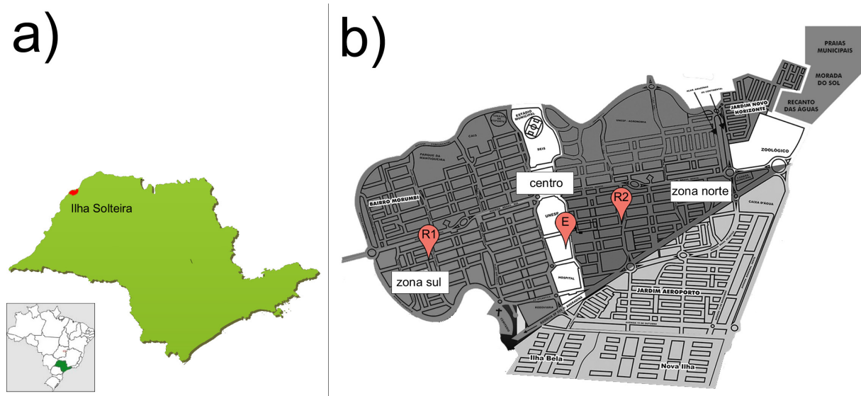
Figura 2 – (a) Localização da cidade de Ilha Solteira/SP (REDE CIDADE DIGITAL, 2018). (b) Mapa da cidade de Ilha Solteira e locais estudados (ILHA SOLTEIRA, 2018, adaptado)

O presente trabalho foi realizado no município de Ilha Solteira-SP (coordenadas geográficas 51°06'35" Oeste e 20°39'44" Sul). Os locais estudados foram: duas residências, uma localizada na zona sul (R1) e outra na zona norte (R2) e uma instituição de ensino particular, localizada no centro (E) (Figura 2), sendo que todos os locais se encontravam implantados com gramado ornamental de grama esmeralda.