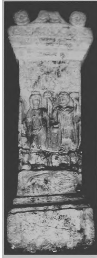
Fig. 3. Altar representando Nantosuelta e Sucellus , deuses gauleses, ainda cultuados no período imperial (Museu de Metz) (Fauduet 1993: 13)

Nossa proposta de pesquisa de doutorado tenta estabelecer um quadro das divindades cultuadas nas capitais de ciuitates galo-romanas, procurando realizar uma análise atenta de seus contextos e as relacionando com a nova configuração política hierárquica do território. As discussões teóricas esboçadas na primeira parte da nossa comunicação nos acompanharão pelos próximos anos de pesquisa e serão vistas em contraste com os dados que o documento arqueológico fornecer. Desta forma, esperamos compreender qual o papel político da religiosidade na Gália Romana.