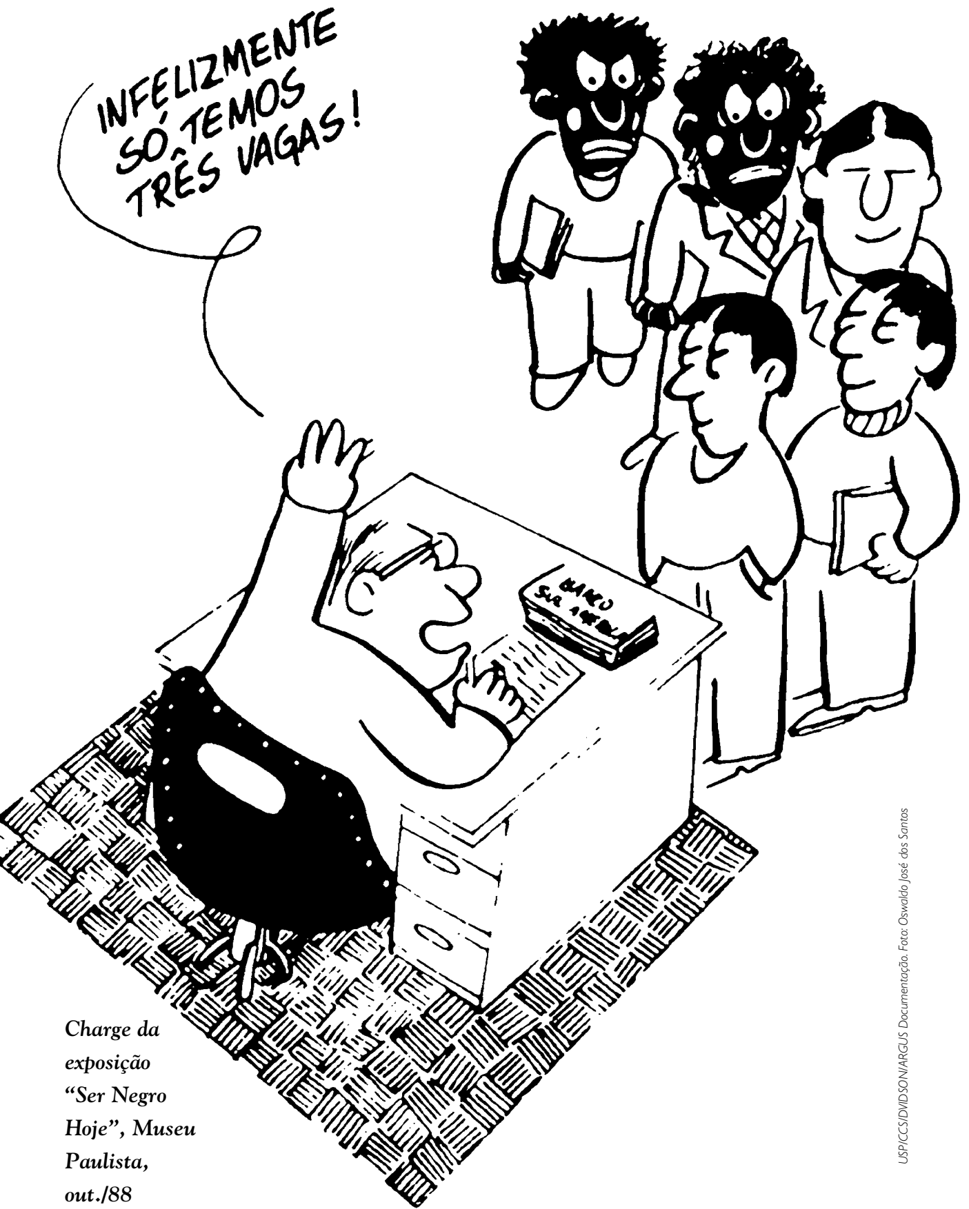
Charge da exposição "Ser Negro Hoje", Museu Paulista, out./88