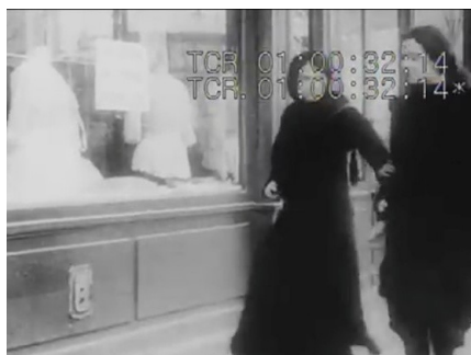
Figura 1: Amiga de Louise (provavelmente a personagem Laure) para Louise diante da loja.