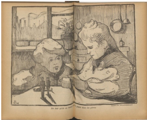
Figura 5: Diga-lhes que não matem os papais nas greves . Georges Bradberry.