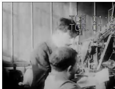
Figura 12: Caminha em direção ao primeiro plano, e passa as instruções ao segundo funcionário.