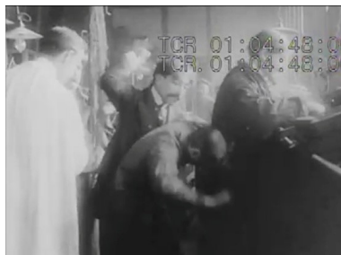
Figura 13: Após vir pelo plano de fundo, o contramestre repreende o jovem funcionário. De jaleco branco, o militante enfrentará o contramestre.