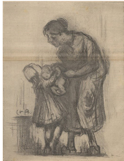
Figura 6: Sem título (uma mãe e duas crianças). Charles Angrand.