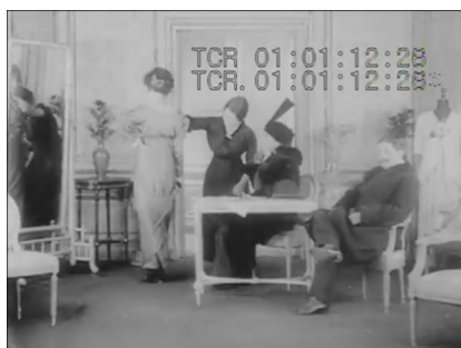
Figura 3: No interior da loja, a dona mostra vestido para clientes burgueses.