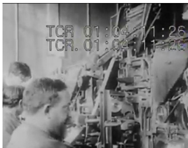
Figura 11: No fundo do plano, o contramestre passa instruções em tom energético ao funcionário.