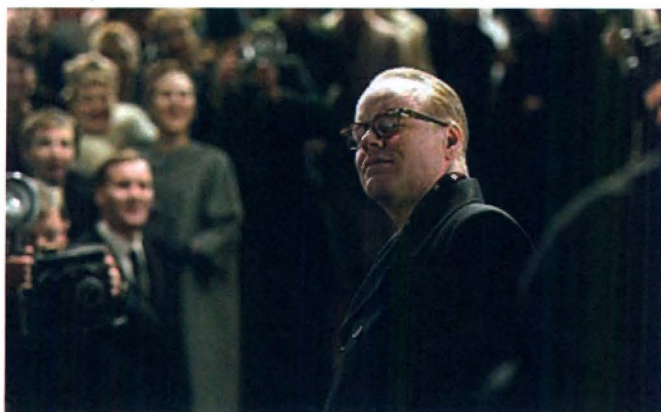
Fig. 2: Filme Capote

De um profundo interesse em esquadriñar aquela alma, seguido de um certo desejo, Capote passa a sentir-se pressionado, perseguido pela continuidade da existência daquele ser, sentindo-se deprimido, partindo para ações intempestivas, como cortar o pagamento dos advogados. A vida de Perry, que inicialmente garantia o seu deleite, passa a inviabilizar a sua própria realização: o desfecho do livro. Dois distintos aspectos demarcam esta passagem: as suas motivações e a temática que lhe causa interesse. As motivações, muito distante da busca de excelência, significam a realização fugaz, a busca do fortuito, que é a admiração pública: