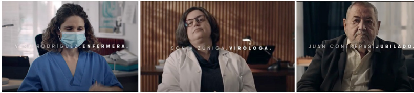
Figura 3. Campaña del Ministerio de Sanidad en España.