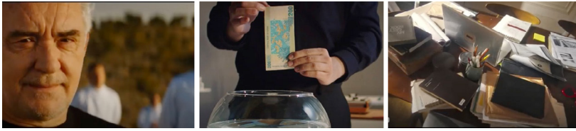
Figura 5. Campañas emitidas en España.