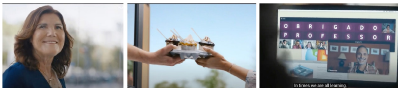
Figura 4. Campañas emitidas en Portugal

los jóvenes. En el contacto físico aún permanecen las mascarillas, ahora son de tela y de diferentes colores. También en Vodafone (véase figura 4 derecha), pero esta vez en el ámbito educativo, una clase de estudiantes conectados a una videoclase muestran cada uno una palabra en pantalla para formar la frase “ Obrigado Professor ” (Gracias profesor). Ha sido un año duro e intenso para los estudiantes, pero también para los docentes que tuvieron que doblar su esfuerzo para no perjudicar el ritmo de aprendizaje. Un esfuerzo extra que parece estar a punto de concluir o que en gran medida ya ha concluido, ha sido un año de resiliencia y trabajo en equipo.