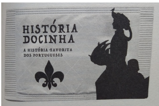
Fig. 2 – História docinha (Lino, 2020, p. 151)