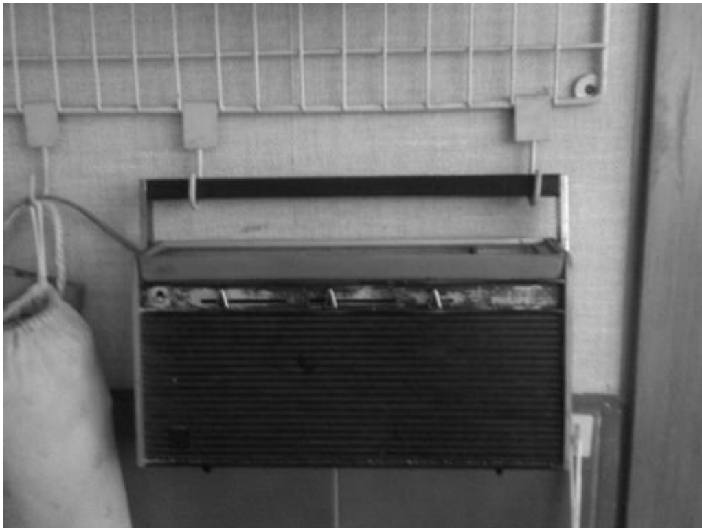
Fig. 2: Fotografía del radio original Philips holandés.

Finalmente, al enfrentar la información de mi abuela con los archivos de la fonoteca, me di cuenta no sólo del respeto y la admiración que se merece ese momento histórico, sino de la necesidad de recuperar las experiencias colectivas que marcaron esas generaciones y que, en este momento, prácticamente ya no existen. Por esta razón, decidí retomar la idea de sacar el radio a la calle para todos, de la radio móvil para los que aún hoy no tienen radio o ya no lo prenden. Volver a la experiencia pública y libre de circular con los sonidos que transmitían las emisoras radiales de los años 1930 y 1940, en Bogotá, apelando a la memoria de los que vivieron esa época y de los que podrían cuestionarse sobre el origen de lo que viven hoy.