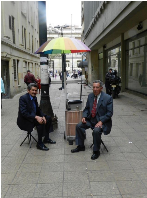
Fig. 3: Fotografía Philips holandés, Calle 14 debajo de la 7ma.

Esas voces, presentadas aquí como transmisiones radiales de 1930 y 1940, son las que libremente están generando conexiones (abuela, radio, Bogotazo, memorias, recorridos) que nos llevan a diseñar una experiencia, a diseñar una estrategia para traer del pasado lo olvidado. Descubrir que una intervención urbana es lo que se necesita para poner a conversar dos tiempos que merecen ser conectados. Ya muchas de las ideas que tenemos hoy tanto los artistas como los diseñadores se han hecho, pero la pregunta no es ¿qué hacer para solucionar esa incertidumbre? sino pensar en ¿qué necesitamos para seguir produciendo resultados que transmitan un mensaje y tengan nuevamente una voz?